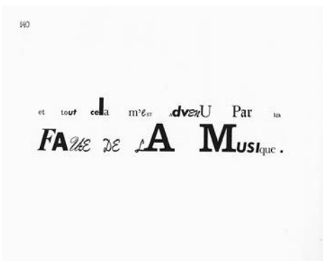
John Cage, Song Books , 1970.