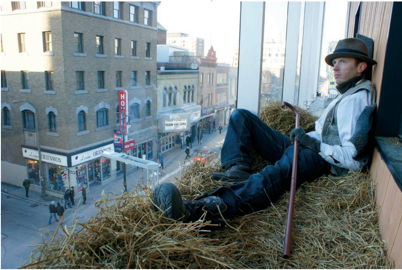
Thierry Marceau, 1/100 de 2-22, [J'aime Montréal et Montréal m'aime], 2-22, Montréal, 2012.