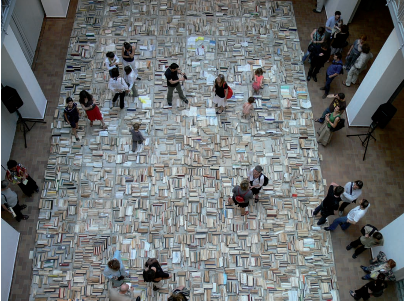
Blinken OSA Archivum Concrete Exhibition , vue d'installation | installation view, Galeria Centralis, Budapest, 2008.