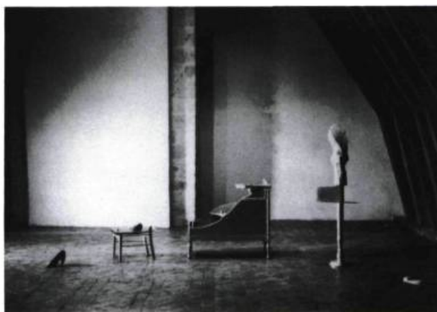
Gilles Mihalecan, Burnes gaspésiennes , 1987. Bois, verre, plâtre, métal, mousses synthétiques, savon, éponge, gomme à effacer ; 142 x 320 x 135 cm. Collection de l'artiste.