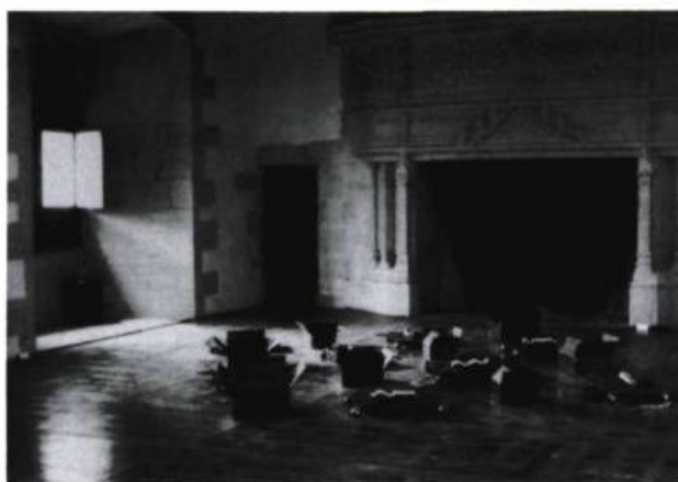
Michel Goulet, État des directions , 1990. Acier, aluminium, polyester et objets divers ; 350 x 350 x 30 cm. Collection de l'artiste.