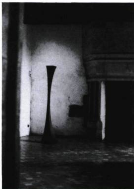
Jocelyne Allouche, Solstice (détail) , 1992. Photographies noir et blanc, bois laqué, verre teinté, clair et dépoli, graphite et plomb ; 224 x 620 x 930 cm. Collection de l'artiste.