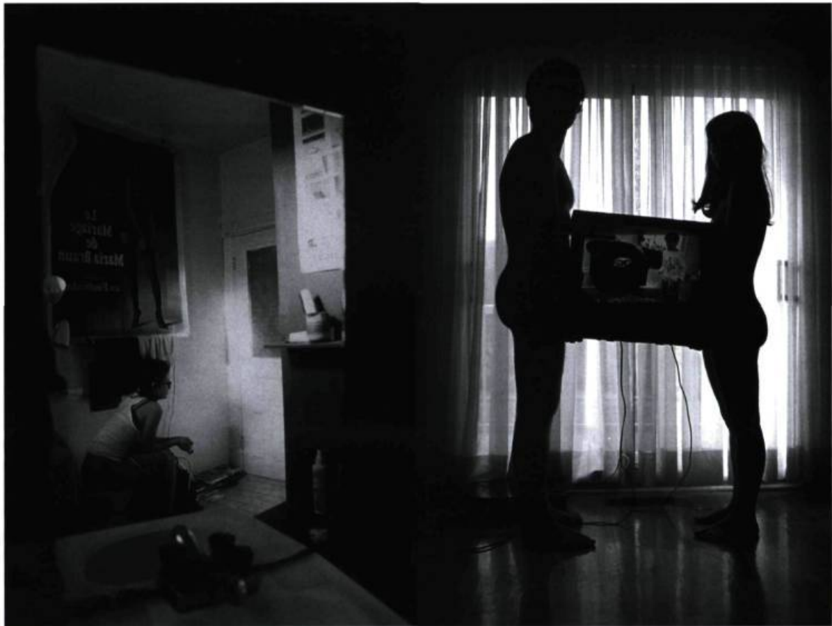
Ève K. Tremblay, Le pipi dans le lavabo , de la série Je suis en amour en anglais , 2000. Épreuve argentique; 40, 6 x 50, 8 cm.