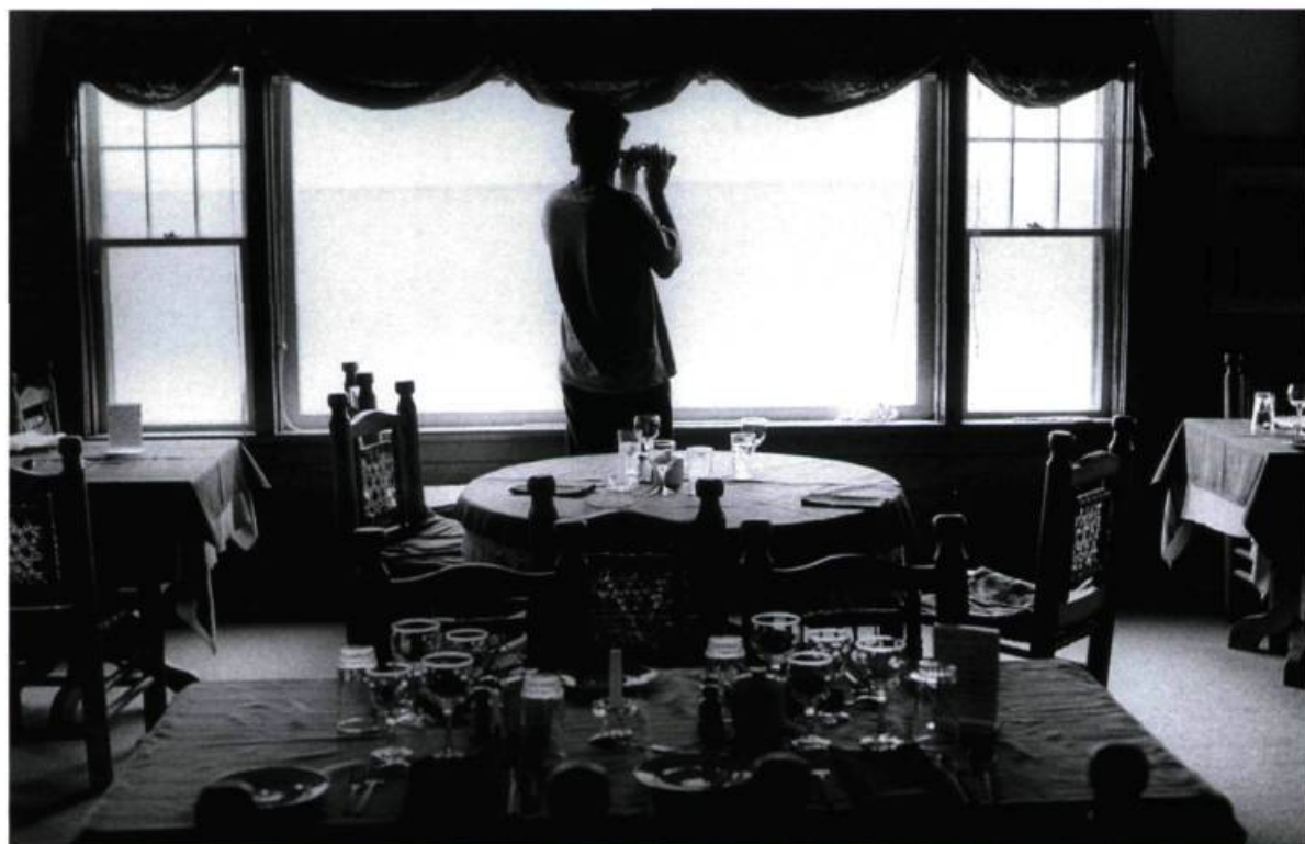
Ève K. Tremblay, Le repas oublié de la série Je suis en amour en anglais , 2000. 40, 6 x 50, 8 cm.