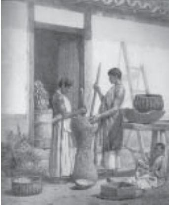
Figure 4.1. “Noirs pilant des grains de café”, Victor Frond.