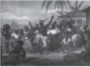
Figure 1.1. "Fandango no Rio de Janeiro" Augustus Earle, années 1820.