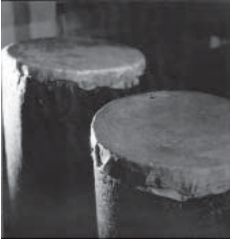
Figure 5.4. Les tambours.