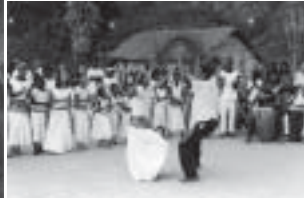
Figure 1.2. Jongo da Serrinha au Quilombo Sao José, Dafne Vital Brazil, 2003.