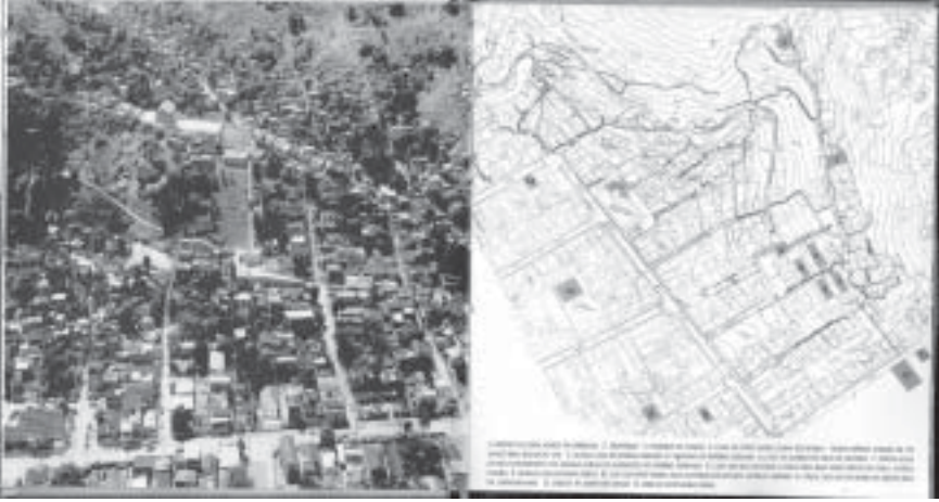
Figure 5.1. La Serrinha et sa carte.