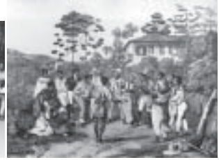
Figure 1.3. "Batuque", Johann Mautritz Rugendas, 1835.

Le tableau « Fandango no Rio de Janeiro » (figure 1.1), d'Augustus Earle, datant des années 1820, montre une réunion d'esclaves lors d'une danse dont la chorégraphie s'apparente grandement à celle d'une démonstration du Jongo da Serrinha 10 réalisée dans la cour du quilombo São José da Serra 11 en 2003 (figure 1.2). On peut y voir une partie du cercle [ roda ] en portugais 12 qui entoure le couple « soliste » qui est au centre. Durant le jongo , les gens qui composent le cercle répètent les paroles [ ponto ] chantées par le jongueiro ou maître jongueiro . Le groupe situé dans le cercle tape des mains pour accompagner le rythme joué par les tambours. Le couple soliste exécute l' umbigada : mouvement de rapprochement des nombrils de l'homme et de la femme, sans qu'ils puissent aller jusqu'à se toucher (Carneiro 1982).