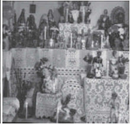
Figure 5.5. L'autel.