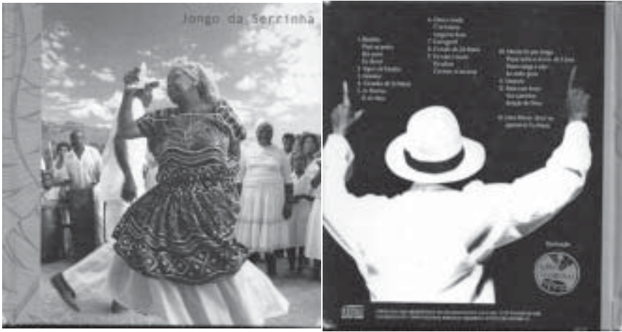
Figure 2. 1. Couverture du livre-CD “Jongo de Serrinha”