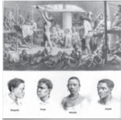
Figure 4.2. “Nègres au fond de cale” et “Visages”, Johann M. Rugendas.