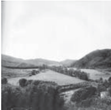
Figure 5.2. Le Quilombo Sao José da Serra.