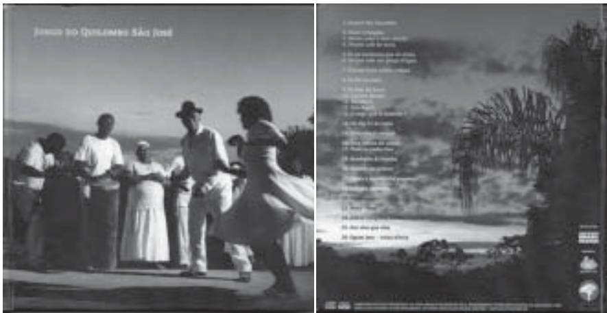
Figure 2.2. Couverture du livre-CD “Jongo do Quilombo São José”