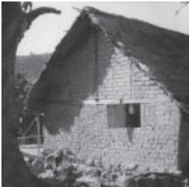
Figure 5.3. Maison en adobe.