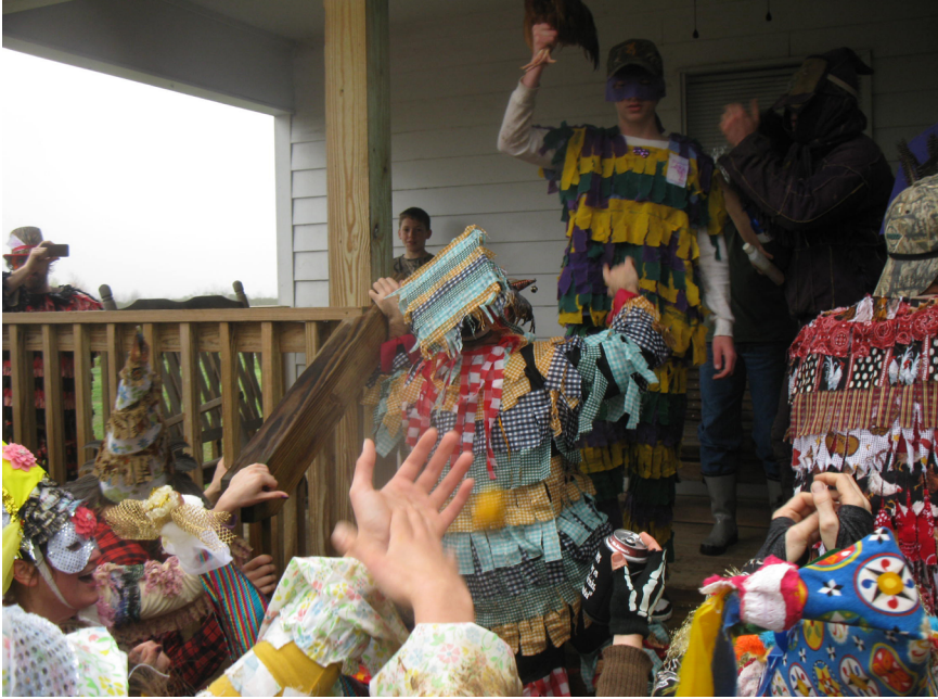
Figure 9. Les Mardi gras demandent la charité aux voisins

We are all friends. We keep in touch by music festivals, cultural events, Facebook. We know each other very well but we don't live in the same location. It's something extremely modern 24 .