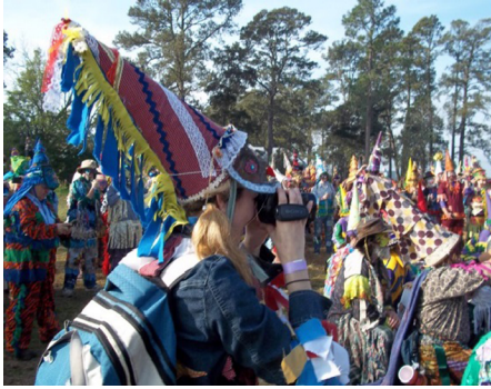
Figure 5. Observation participante du Courir du Mardi gras en costume traditionnel.

gras, reposée et rassasiée, reprend la route, toujours dans la fête, la musique, les chants et, pour plusieurs, en buvant de l'alcool.