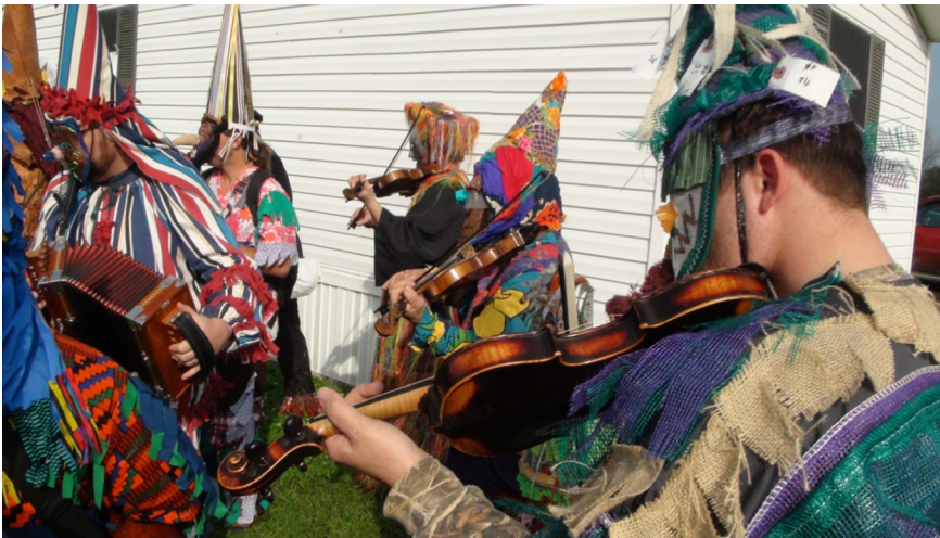
Figure 8. Musiciens du Courir du Mardi gras de Faquetaigue.

Toutefois, le Courir du Mardi gras de Faquetaigue ne correspond pas à l'image traditionnelle d'une communauté cadienne célébrant le Mardi gras. Les participants à ce Courir, pour la plupart, ne sont pas de la région.