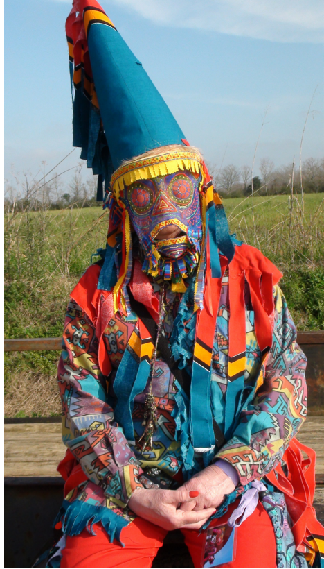
Figure 4. Détails d'un costume du Courir du Mardi gras de Faquetaigue.

Suite au défi du poteau et dans la foulée des festivités, c'est à cet endroit que, pour la première fois en 2012, on a servi du boudin aux participants du Courir de Faquetaigue. Très heureux et surpris d'une telle innovation, ils se sont rués, affamés, vers les camions qui distribuaient gratuitement la nourriture. Un peu plus tard, au signal du Capitaine, la troupe des Mardi