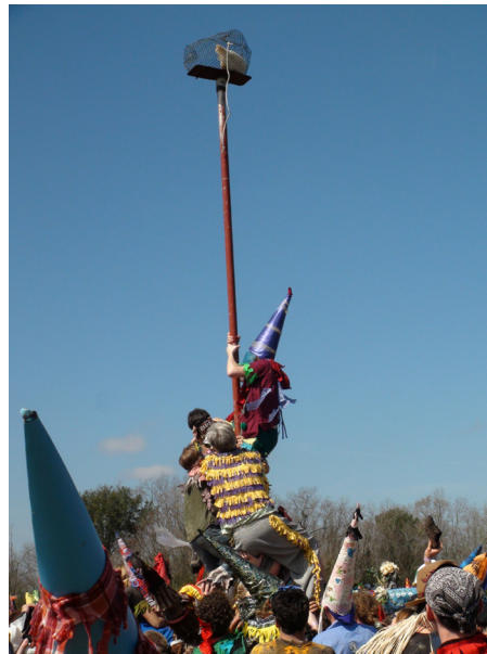
Figure 6. Le défi du poteau.

Comme l'a mentionné Lucius Fontenot (2012), le défi du poteau a été inventé à la suite de la