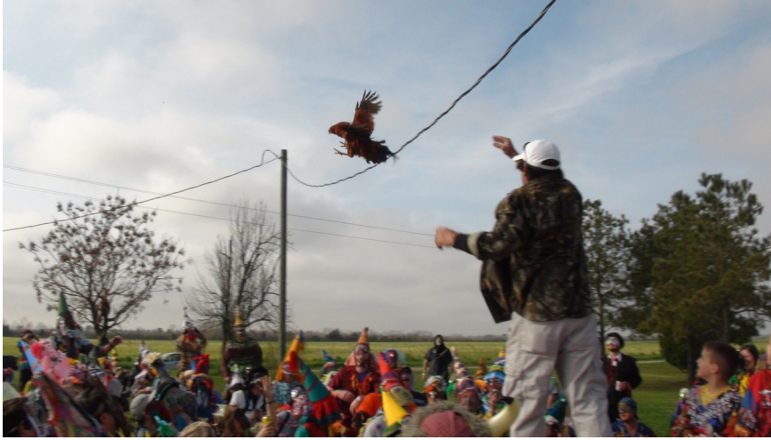
Figure 3. Un voisin lance un poulet en direction des Mardi gras.

années précédentes sont affichées et témoignent de leur fierté à participer à l'évènement. Les hôtes sont très heureux de voir les Mardi gras. Ils les saluent et distribuent toutes sortes de denrées pour la collecte : petits sacs de nourriture, pièces de monnaie (qu'ils appellent « cinq-sous »), etc. Il est à noter que ces dons sont symboliques, car à Faquetaigue, on ne mangera pas cette nourriture le soir même : on cuisine un gombo pendant la journée, qui sera prêt au retour des Mardi gras. Les Mardi gras se mettent à genoux, quêtent et scandent : « Donnez quelque chose pour les Mardi gras ! » Puis le maître de maison s'avance. C'est le point culminant du passage des Mardi gras chez eux : le lancer du poulet. Les Mardi gras demandent la charité pour le poulet, en criant et chantant. D'un geste décisif, le voisin lance l'animal dans les airs. La foule se bat féroce pour obtenir le précieux prix. Une fois le poulet attrapé, les Mardi gras dansent joyeusement au son des musiciens.