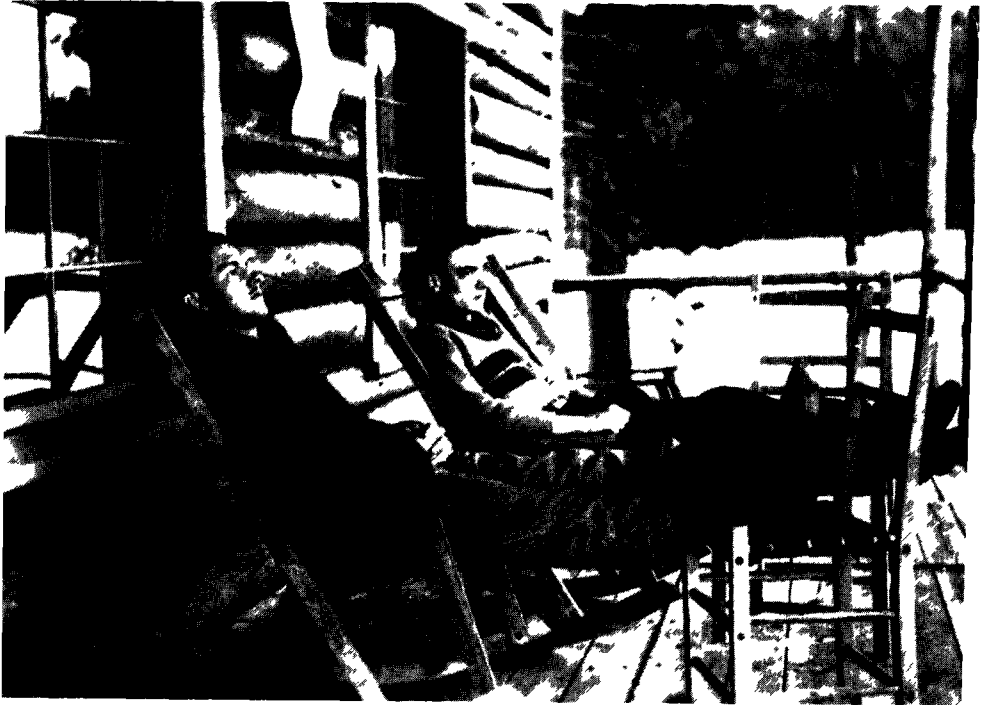
Saint Denys Garneau et André Laurendeau, à la maison de campagne des Laurendeau, à Saint-Gabriel-de-Brandon, mai 1932