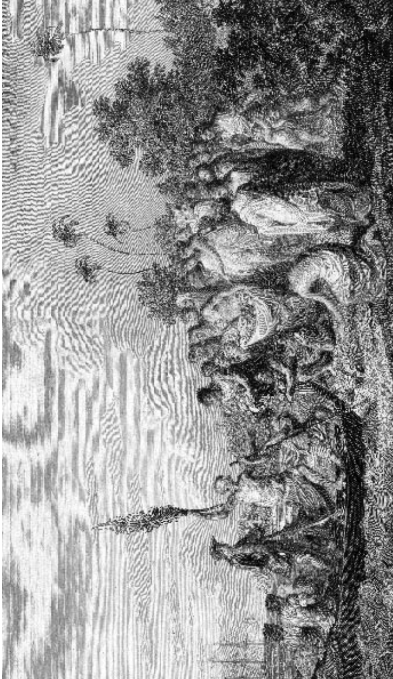
Figure 4. « The Landing at Middleburgh, One of the Friendly Isles », détail. Gravure au burin et à l'eau-forte de John Keyse Sherwin d'après un tableau de William Hodges, dans James Cook, A Voyage Towards the South Pole, and Around the World. Performed in His Majesty's Ships the Resolution and Adventure, in the Years 1772, 1773, 1774, and 1775. Written by James Cook, Commander of the Resolution. In which is included, Captain Furneaux's Narrative of His Proceedings in the Adventure During the Separation of the Ships. Illustrated with Maps and Charts, and a Variety of Portraits and Views Drawn During the Voyage by Mr. Hodges, Londres, Strahan & Cadell, 1777, vol. I, planche LIV (intercalée entre les p. 192-193), 50,8 x 28,6 cm (page), National Library of Australia, Canberra.