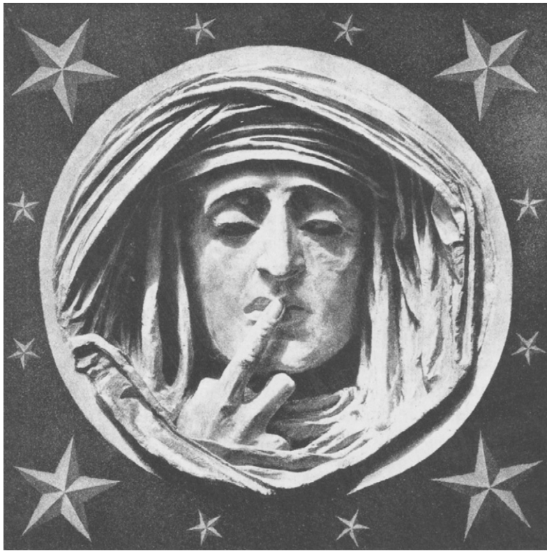
Charles NÈGRE, Le mystère de la mort , Héliogravure, 1858, d'après le Silence de Préault, Paris, Musée d'Orsay.

Vocale ou instrumentale, la musique a partout et de tout temps accompagné les rituels funéraires. Or cette notion même d'accompagnement prend aujourd'hui une dimension inédite. La musique d'accompagnement des rituels est le plus souvent conçue comme un adjuvant de ces derniers : non pas un lieu central de signification, mais un à-côté, un embellissement, une ornementation. Encore faudrait-il réfléchir aussi à cette dernière notion. Il arrive souvent, dans les pratiques humaines, que les productions de sens les plus importantes passent par les marges, voire par la gestion du futile (voir Lemieux, 2000). Ainsi, dans les marines anciennes, on appelait ornementation la voilure d'un navire. Or, si la voilure possède une incontestable valeur ornementale, faisant la différence entre