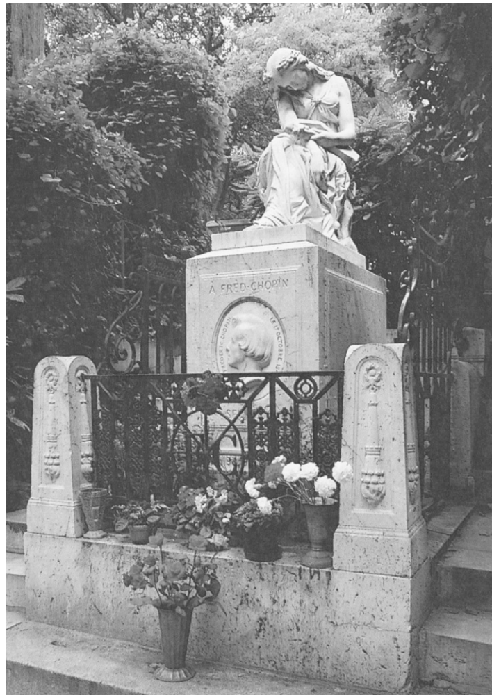
A. CLESINGER, La Musique en pleurs , tombe de CHOPIN, 1850, marbre, cimetière du Père-Lachaise, Paris, France.

De juillet à novembre 1791, cependant, la santé de Mozart se met à décliner. Des pressentiments l'assaillent. Ce Requiem , est-ce pour lui-même qu'il le compose ? Temps d'angoisse ! Il en a la certitude, peu à peu : cette maladie qui l'étreint est mortelle. Il n'en sortira pas vivant. C'est ainsi, durant ces sombres mois, qu'il compose le Requiem : qu'il tente, du moins, de le mener à bien, y pensant tout le temps sans pouvoir s'y mettre ; préoccupé par celui-ci, presque obsessionnellement, sans parvenir à s'en occuper. S'il s'y consacrait entièrement, n'accélérerait-il pas son pro-