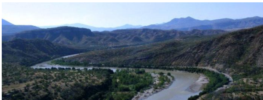
Le Haut Balsas, Guerrero, Mexique.

Ce sont les communautés nahuas du Haut Balsas (Figure 1) qui serviront à illustrer mon propos. Elles se sont installées dans cette région de l'ancien Guerrero, au Mexique, il y a au moins huit cents ans si l'on en croit les documents archéologiques et historiques (Paradis, 2001, 1995; Barlow, 1948). L'archéologie nous les révèle par la présence de nouvelles traditions céramiques dont certaines locales et d'autres importées du bassin de Mexico. C'est autour de 1270, ou même auparavant, que les premiers groupes nahuas, les Coixca, pénètrent dans le nord du Guerrero en provenance du Michoacan (Tableau 1). Ils sont en relation avec les autres groupes nahuas qui s'étaient installés dans le bassin de Mexico (Mexico) et le Morelos (Tlahuica) quelque temps auparavant. Quelques siècles plus tard, entre 1427 et 1440, survient la première conquête du Nord