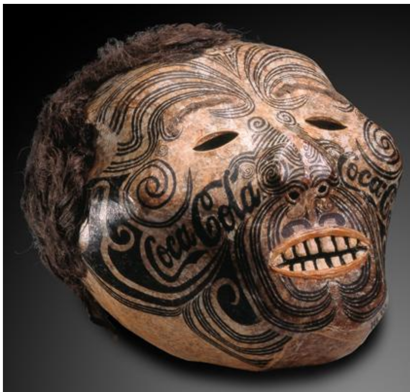
Andreas Dettloff, Crâne momifié māori , 1993. Technique mixte, 27 x 27 x 22 cm. Tahiti.

L'évocation de la mort se donne à voir par la figuration de restes humains, ici en l'occurrence une tête séchée. La mort n'est pas déguisée, esquissée ou suggérée, elle est nue et se confronte à nous. Dettloff nous dit à tous : voilà le devenir de chacun, et non seulement une trace de notre passage. L'humour est sarcastique et, pour reprendre les mots de Baudelaire sur la caricature et l'essence du rire, peut être décrit comme « mordant et voilé » (Baudelaire, 1855, p. 15). De prime abord, la tête séchée arbore pour les non-initiés des tatouages esthétiques mais non signifiants. Mais en la regardant avec plus d'attention, des lettres émergent de ce jeu de courbes et de contre-courbes; sur les zygomatiques, la mention Coca-Cola devient alors lisible. Aussitôt, cette tête séchée fleurie de tatouages renvoie à l'ailleurs, à l'exotique, au mythe de la découverte de cet alter préservé. Le texte, pour sa part, résume à lui seul l'essor de l'industrialisation et de la mondialisation. Il est le symbole du développement par l'économie du capital; le symbole de la diffusion des biens et de l'uniformisation des besoins. L'Occident est alors juxtaposé avec l'ancien, le préservé, le sauvage. L'anachronisme est mordant et l'humour dépend de la capacité du spectateur à voir cette supercherie. L'artiste raconte une anecdote liée à la présentation de cette oeuvre lors de la biennale de Lyon :