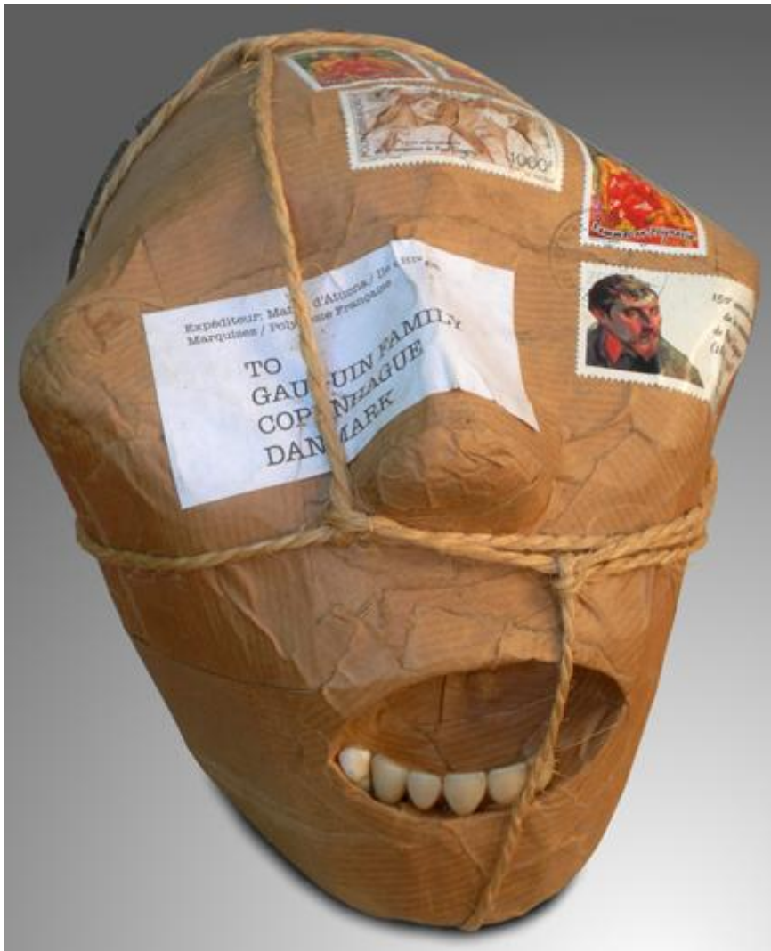
Andreas Dettloff, Le Crâne de Gauguin restitué et renvoyé à sa famille , 2002. Technique mixte, 25 x 15 x 13 cm.

Le crâne semble difforme, comme pour exprimer le Gauguin « sauvage », celui qui vécut au contact des autochtones. Emballé et ficelé, l'objet est prêt à être expédié. Le destinataire n'est nul autre que la « famille de Gauguin », comme pour humaniser cet objet emballé et ainsi montrer la valeur humaine derrière « l'objet inaliénable ». Sur ce crâne, il y a des timbres émis par l'Office des Postes et des Télécommunications de Polynésie française (O.P.T.). La mort est affranchie et prête à voyager. Comme ces timbres montrent le visage et des oeuvres de l'artiste, c'est lui qui s'affranchit lui-même. La mort a ici un prix, à savoir celui des frais de port. Avec une série de plus de cent crânes, Dettloff propose d'autres niveaux de lecture qui découlent tous du choc des cultures et de leur redéfinition par la société contemporaine.