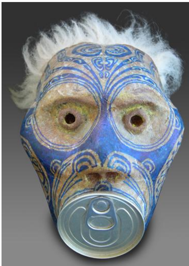
Andreas Dettloff, La Parole Conservée , 2002. Noix de coco, vessie, pigments, métal, poils, 25 x 15 x 13 cm. Collection privée, Tahiti.

Les cheveux hirsutes, les couleurs fortes, sont autant d'éléments permettant une telle lecture de l'oeuvre. L'autochtone fait face au colon, la bouche est scellée pour symboliser le tabou imposé. Selon une perspective différente, l'opercule de la boîte de conserve peut aussi renvoyer à l'image d'une tétine dans la bouche d'un enfant, venant conforter cette notion d'insouciance et d'incrédulité des Polynésiens face aux « bons colons ». L'oeuvre met ainsi en rapport les sociétés et malgré l'histoire lourde, l'artiste parvient par le biais des jeux de couleurs et de ces orbites circulaires, irréelles, à faciliter la transmission du message au moyen de l'humour.