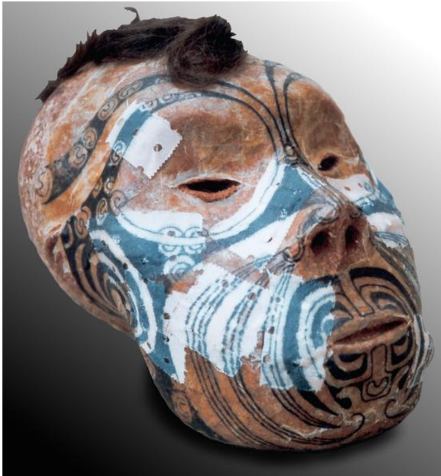
Andreas Dettloff, Crâne aux tatouages soignés , 2001. Technique mixte, 17x13x12 cm. Collection privée, Tahiti.

L'oeuvre peut traduire la réappropriation du tatouage par les populations insulaires de l'Océanie, et même une tentative de consolidation de l'être. Les vides des tatouages sont alors comblés par l'adjonction des morceaux de papier, eux-mêmes tatoués. Le procédé du tatouage fut interdit par les missionnaires (de même que nombre d'autres pratiques ancestrales) qui y voyaient la manifestation d'une « religion païenne ». Il n'a été réhabilité qu'à la fin du XX e siècle, sans pour autant entraîner une remise en cause de la foi nouvelle apportée par les missionnaires.