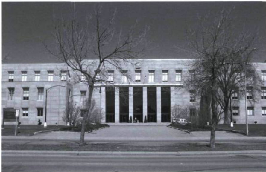
Illustration 4. Édifice de l'Imprimerie nationale du Canada, œuvre de l'architecte bien connu Ernest Cormier.

l'«Imprimeur de la Reine» (illustration 4), en 1954. Seules la menace séparatiste et l'arrivée au pouvoir du Parti québécois ont déclenché la construction en rafale de la Place du Portage, du Centre Asticou, des Terrasses de la Chaudière, des immeubles Fontaine et Vincent-Massey et du Musée des Civilisations, moyen pour le gouvernement fédéral d'affirmer sa présence en sol québécois.