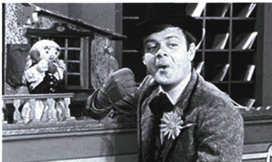
Illustration 2. Guy Sanche: Bobino .

«On était à la veille du jour de l'an 1858, en pleine forêt vierge, dans le chantier des Ross, en haut de la Gatineau. [...] Mon homme me proposait de courir la chasse-galerie et de risquer mon salut éternel pour le plaisir d'aller embrasser ma blonde, au village. [...] Il s'agit d'aller à Lavaltrie et de revenir dans six heures» 11 .