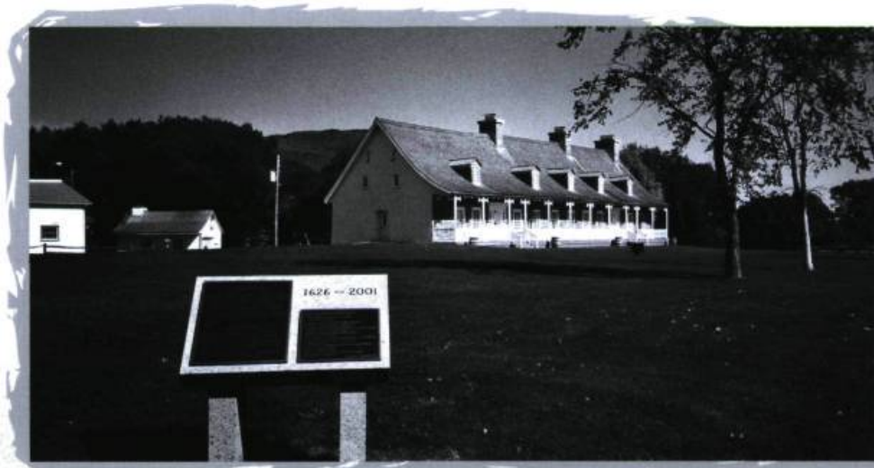
Côte-de-Beaupré : la Petite Ferme de Saint-Joachim.

C'est cependant à partir du début de la décennie 1660 que la Côte-de-Beaupré connaît son véritable essor. Entre 1662 et 1668, M re François de Montmorency Laval acquiert la totalité des parts de l'ancienne compagnie de Beaupré. Il crée, aux pieds du cap Tourmente, la Petite Ferme en 1664 et la Grande Ferme en 1667 pour subvenir aux besoins des écoliers et des prêtres du Séminaire de Québec qu'il venait de fonder, le 26 mars 1663. Les habitants deviennent donc les censitaires du Séminaire de Québec et notre région connaît un développement rapide au niveau de sa population et de son organisation économique et religieuse. Plus tard, en 1695, M re de Laval et le Séminaire font construire le premier moulin industriel du territoire, le moulin de Petit Pré, pour