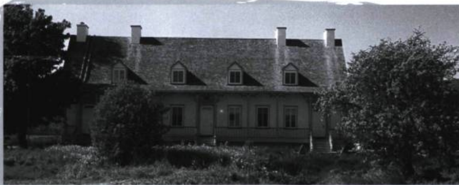
Bâtiment principal de la Grande Ferme à Saint-Joachim.

Dans les faits, l'histoire de notre territoire est étroitement liée à la fondation de la ville de Québec car, depuis le début de la colonie, notre région se présente comme son complément naturel. Quatre ans après le premier établissement en Acadie, c'est la Côte-de-Beaupré et la ville de Québec qui ont donné réellement vie à l'implantation française permanente en Amérique. Il faut préciser qu'il s'agit bien de l'implantation française, car cette terre était déjà habitée par les Iroquoiens qui appréciaient les embouchures des nombreux cours