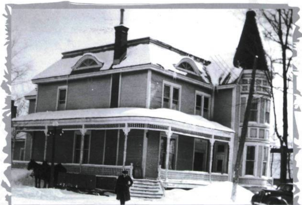
Maison Prévost en 1932. Des lucarnes arrondies et vitrées éclairaient l'entresol avec la lumière naturelle.

L'Unité sanitaire de Terrebonne avait été inaugurée à Saint-Jérôme en 1929. Ces établissements sanitaires, que le gouvernement du Québec mettait sur pied à travers la