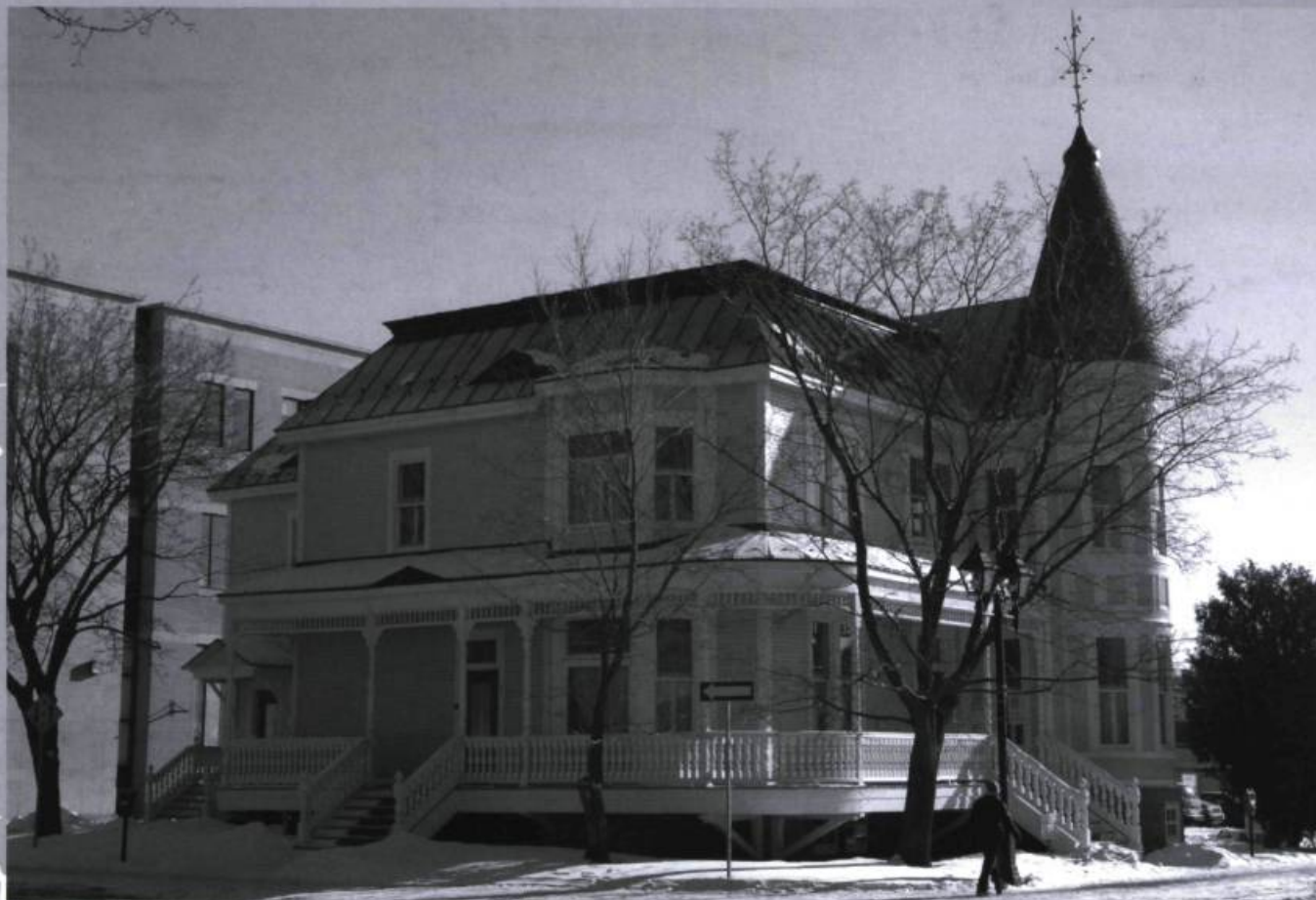
Maison Prévost en 2007. Elle représente indéniablement l'une des plus belles résidences d'intérêt historique et patrimonial de la ville de Saint-Jérôme.