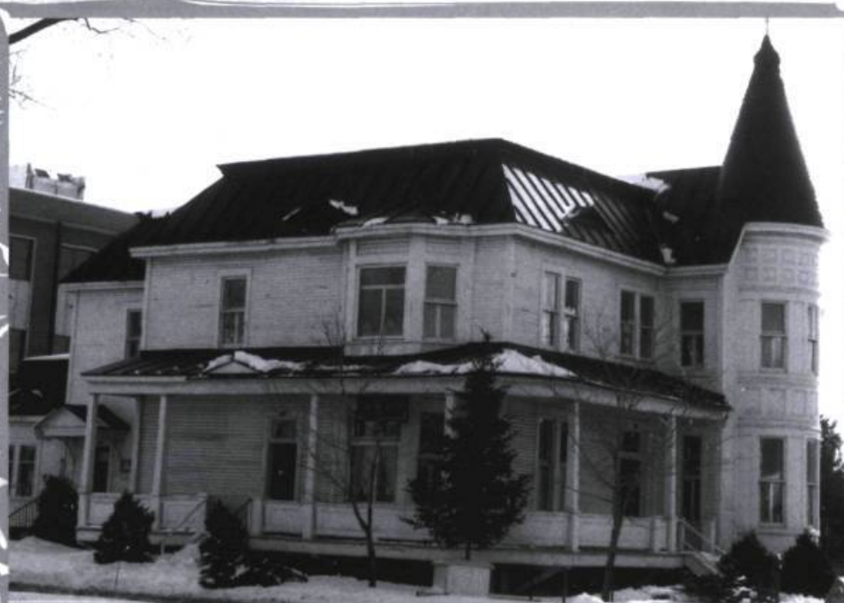
Maison Prévost en 1986. La cheminée fait place à une baie vitrée offrant une vue sur le parc Labelle.

la somme de 182 000 $. Elle s'engage alors à conserver la maison Prévost et à la mettre à la disposition des organismes communautaires souhaitant s'y loger.