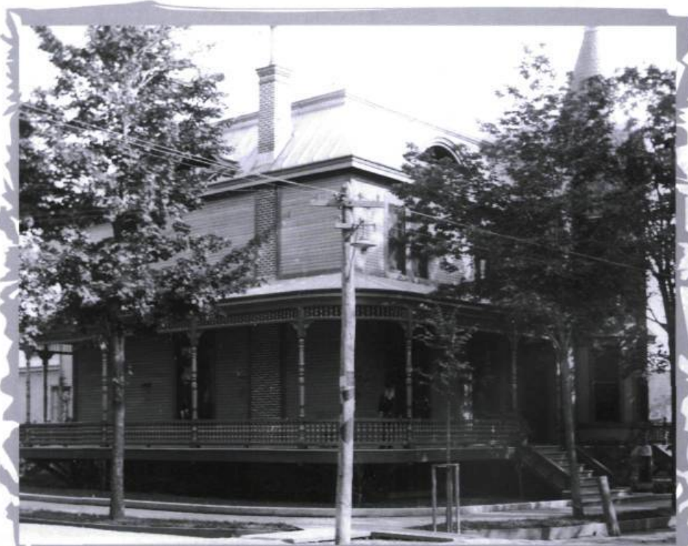
Maison Prévost en 1898. La galerie finement décorée représente une des caractéristiques du style néo-Queen Anne.

L'histoire de la maison Prévost se confond avec celle de l'hôtel de ville de Saint-Jérôme. La Ville, qui commence à prendre de l'importance, se trouve à l'étroit dans ses bureaux. En août 1918, elle loue la maison