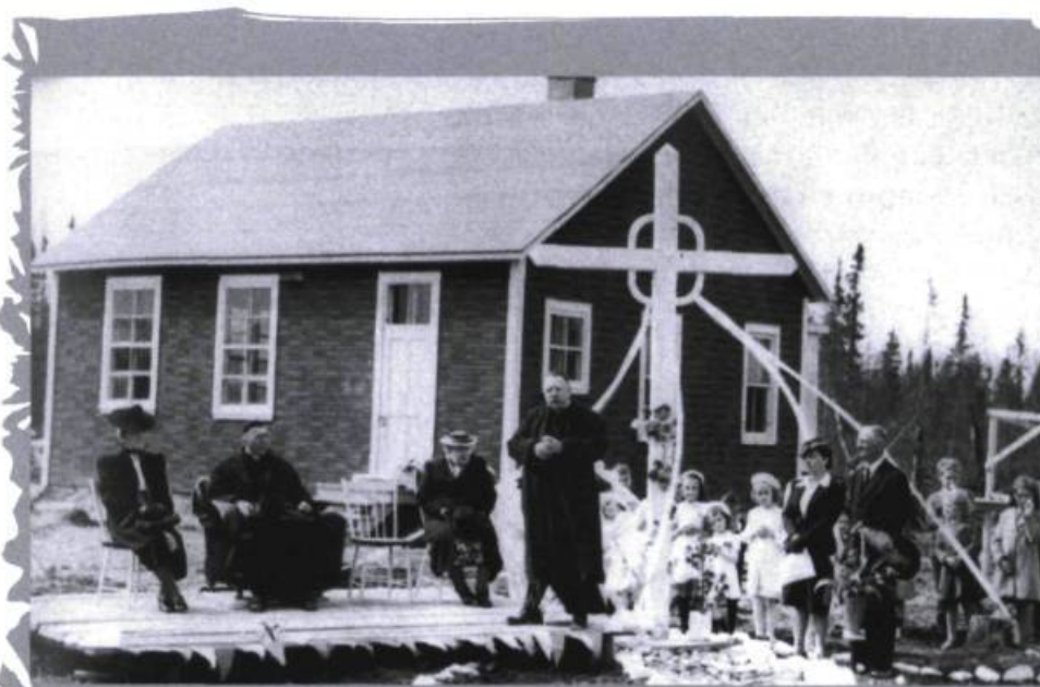
Val-Senneville, 1945.