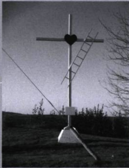
Croix aux instruments de la Passion, dans le Nord-du-Québec, à la croisée du chemin Joutel-Matagami, en 2008.