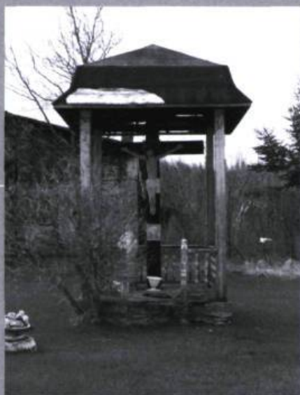
Calvaire, à Roquemaure, en Abitibi-Ouest, en 2008.

Dans la région de l'Abitibi, bon nombre d'entre elles représentent des croix de pionniers, érigées au moment de la prise en main du territoire par le colon.