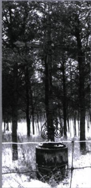
Croix, quartier Destor, Rouyn-Noranda, en 2007.