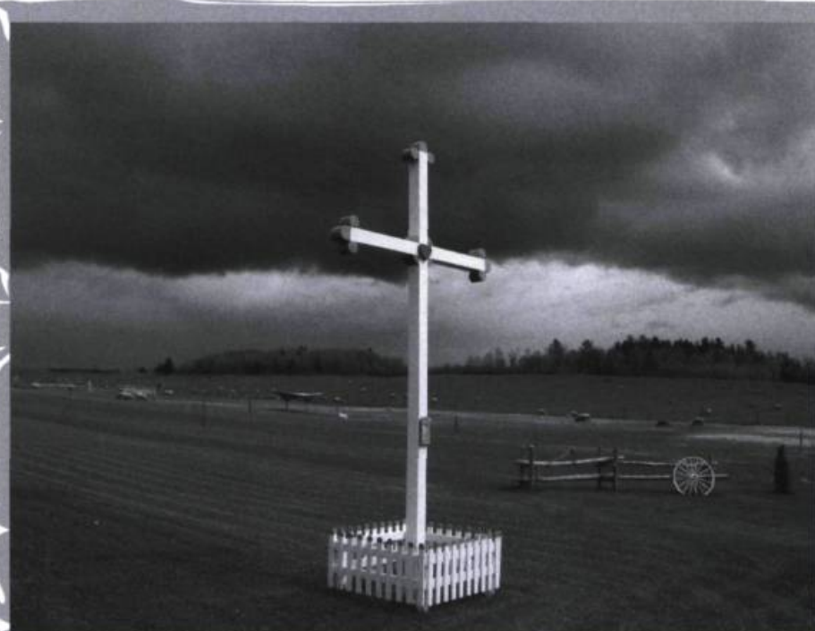
Croix simple, à Lorrainville, au Témiscamingue.