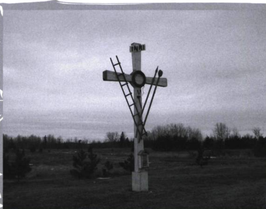
Croix, quartier Montbeillard, en 2007.