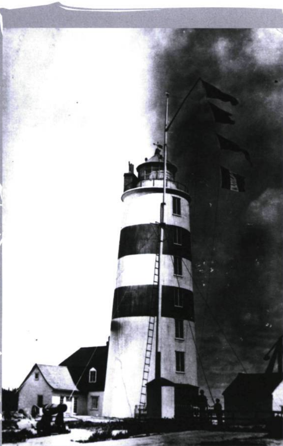
Le Phare de Pointe-des-Monts en 1905.