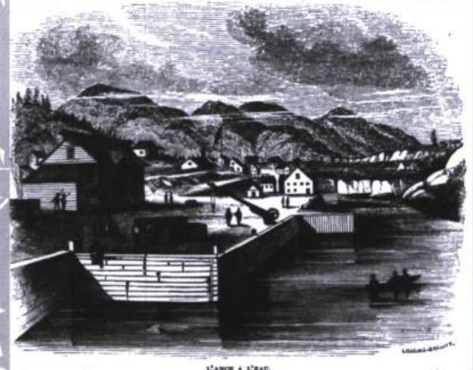
Croquis de Lossing-Barritt présentant l'Anse-à-l'eau, Tadoussac.