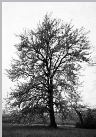
Un des poiriers plantés par les Jésuites à Sandwich, Ontario.

Les auteurs du XIX e siècle déplorent la disparition inévitable des poiriers et, avec elle, celle de la vieille culture française qui doit s'incliner devant le progrès inexorable de la nouvelle république américaine. De là, sans doute, leur propension à créer des légendes qui ajoutent une forte valeur symbolique et patrimoniale à ces arbres menacés. Mais ces poiriers, tout comme la communauté francophone, persistent encore aujourd'hui. Et celle du Détroit a fait de ces arbres, dont l'existence est à la fois précaire et ancienne, menacée mais toujours vivante, le symbole vivant de l'enracinement français dans un des coins les plus éloignés et isolés du Canada français. Lors des Grandes Fêtes du tricentenaire de 2001, la ville de Windsor a reconnu officiellement la puissance de ce symbole en plantant trois poiriers au bord de la rivière Détroit, pour ainsi commémorer l'arrivée des premiers colons sur la rive sud du Détroit, en 1749, ces pionniers à l'origine de la communauté francophone située du côté canadien de la frontière. Les poiriers ont également servi de logo pour une exposition importante sur l'histoire des francophones du sud-ouest ontarien à la Maison François-Baby qui abrite le musée communautaire de Windsor. Lors d'une autre exposition, le musée encouragea les visiteurs à marquer la présence de poiriers sur une carte du comté d'Essex. Grâce à cette initiative, une douzaine de nouveaux spécimens ont été identifiés.