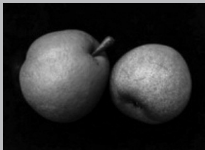
Poires provenant de poiriers plantés par les Jésuites.

Les sources des XIX e et XX e siècles s'entendent sur le fait que le poirier des Jésuites constituait autrefois un des traits les plus frappants de la physionomie du Détroit. Selon le mémorialiste américain Bela Hubbard, qui écrit en 1887, chaque ferme française le long de la rivière Détroit possédait une quantité de poiriers 2 . D'autres sources maintiennent que les arbres étaient toujours plantés en groupe de douze, pour représenter les douze apôtres. On y décrit des spécimens extraordinaires atteignant plus de 20 mètres de hauteur et produisant de 40 à 60 boisseaux de poires chaque année. Plusieurs auteurs remarquent que les poiriers ressemblent plus à des chênes ou à des ormes qu'à des arbres fruitiers. U. Prentiss Hedrick, dans son étude classique The Pears of New York , écrivait en 1921 : « On ne peut écrire l'histoire de la poire en Amérique sans faire mention des magnifiques spécimens de