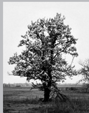
Un des poiriers plantés par les Jésuites à Tecumseh, Ontario.