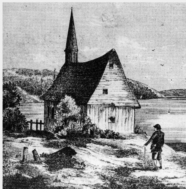
Chapelle du poste de traite de Chicoutimi.

À la suite de la commercialisation du Domaine-du-Roy (territoire que se réserve le roi, s'étendant sur des centaines de kilomètres carrés le long de la rivière Saguenay, de l'île aux Coudres jusqu'à Sept-Îles) par la traite de Tadoussac en 1652, des commerçants construisent une maison à l'embouchure de la rivière Chicoutimi dans le but d'en faire un poste de traite en 1671. Cinq ans plus tard, cet établissement devient officiellement le chef-lieu du commerce des fourrures dans le Domaine-du-Roy. Une chapelle sous le patronage de saint François Xavier est aménagée près du poste. Alimenté par les villages amérindiens du lac Kénogami, le poste de Chicoutimi produit en 1684, à lui seul, plus de pelleteries que tout le reste du Canada réuni.