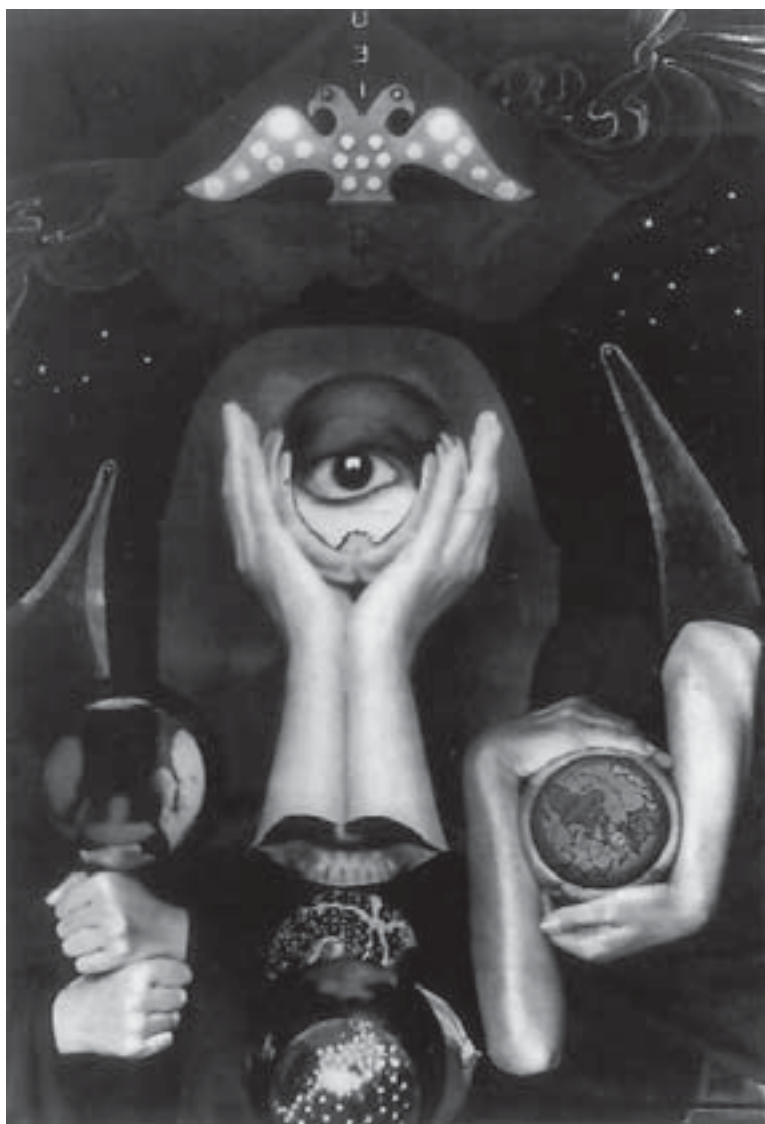
Fig. 4. Claude Cahun, Marcel Moore, Aveux non avenus, Tableau 1 , Photomontage original, 1929-1930, coll. National Gallery of Australia, Canberra.