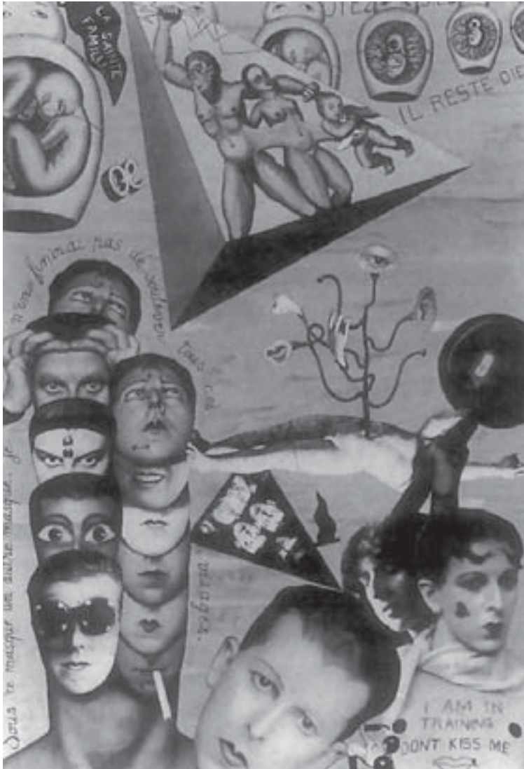
Fig. 5. Claude Cahun, Marcel Moore, Aveux non avenus, Tableau X , Photomontage, 1929-1930, coll. privée (avec l'aimable autorisation de la Galerie Zabriskie, New York).