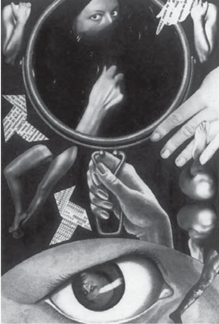
Fig. 8. Claude Cahun, Marcel Moore, Aveux non avenues, Tableau III , Photomontage, 1929-1930, coll. privée (avec l'aimable autorisation de la Galerie Zabriskie, New York).