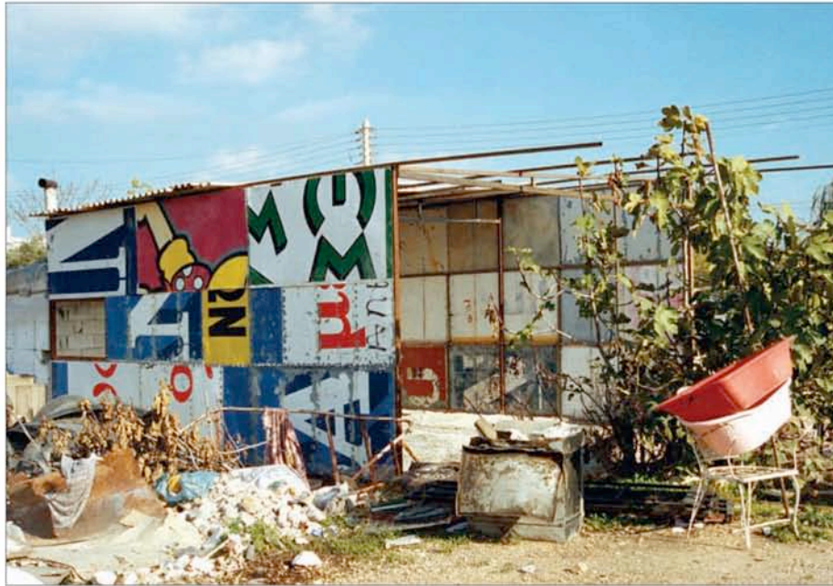
T.A.M.A. (Temporary Autonomous Museum for All): Sans titre , 2000. Tirage Lambda, 1,26m x 1,80m, tiré à 5 exemplaires. Collection privée.