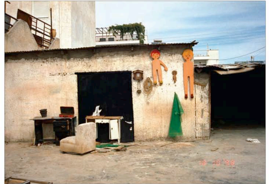
T.A.M.A. (Temporary Autonomous Museum for All): Sans titre , 2000. Tirage Lambda, 1,26m x 1,80m, tiré à 5 exemplaires. Collection privée.