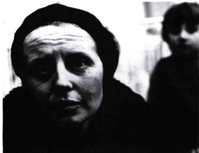
En bas : Krystyna Janda dans L'interrogatoire de Ryszard Bugajski. Prix d'interprétation féminine