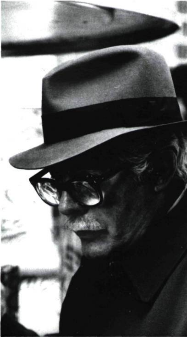
En haut: Marcello Mastroianni dans Stanno tutti bene de Giuseppe Tornatore En bas: Ob! Qu'elles sont Noires les nuits sur la mer Noire de Vassili Pitchou