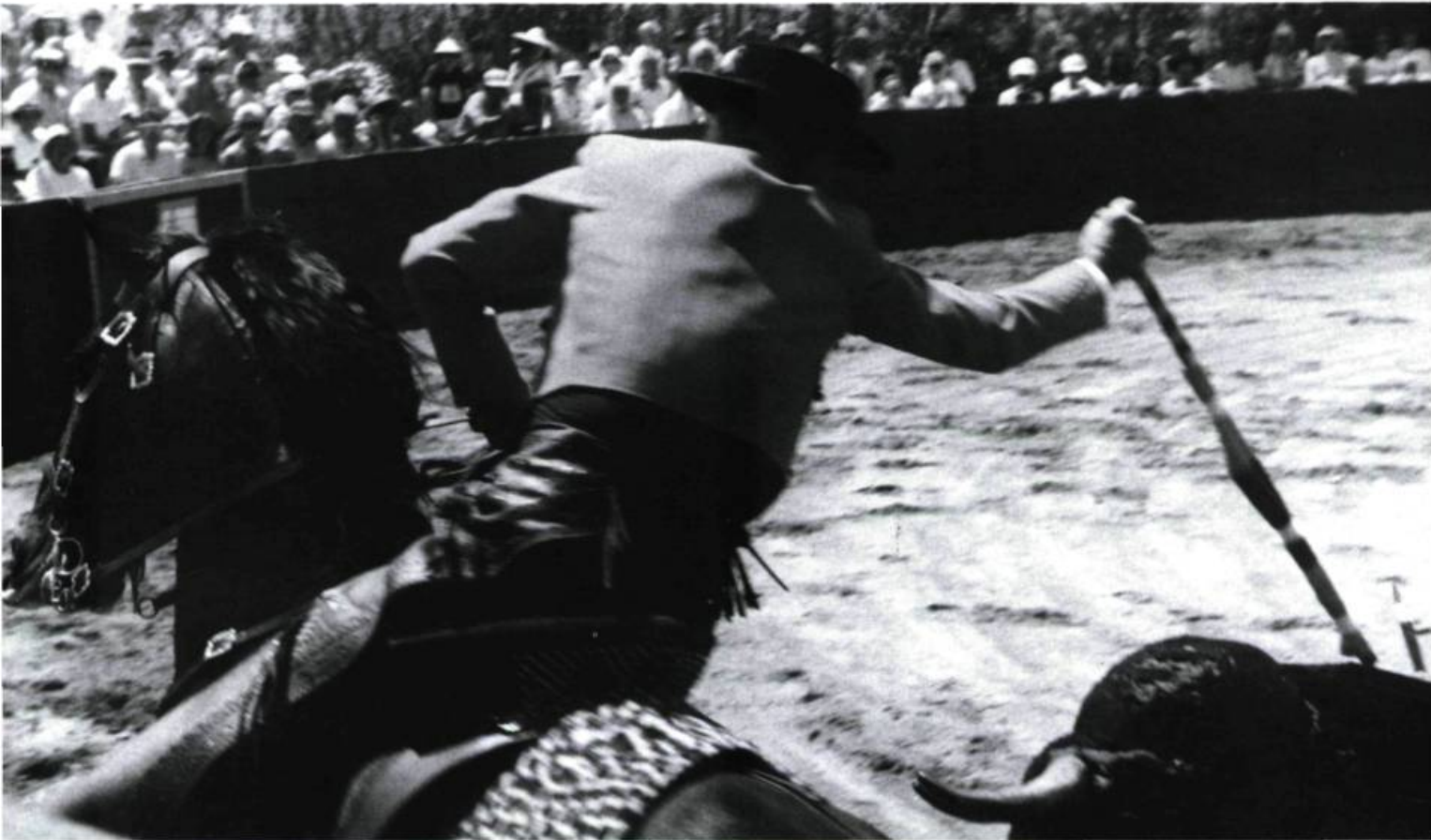
My Kingdom For de Budd Boetticher

système s'ils parvenaient à être projetés aux bons endroits.