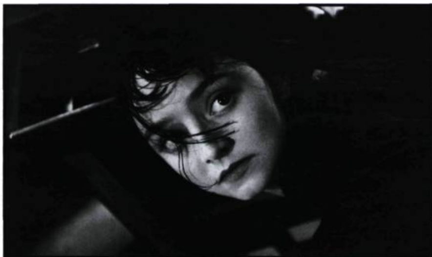
Deux frères, ma sœur de Teresa Villaverde (24 images n° 78-79).

Le ballon blanc Panahi Coûte que coûte Claire Simon Le temps de l'amour Makhmalbaf La baine Kassovitz Georgia Grosbard Crumb Zwigoff Casino Scorsese