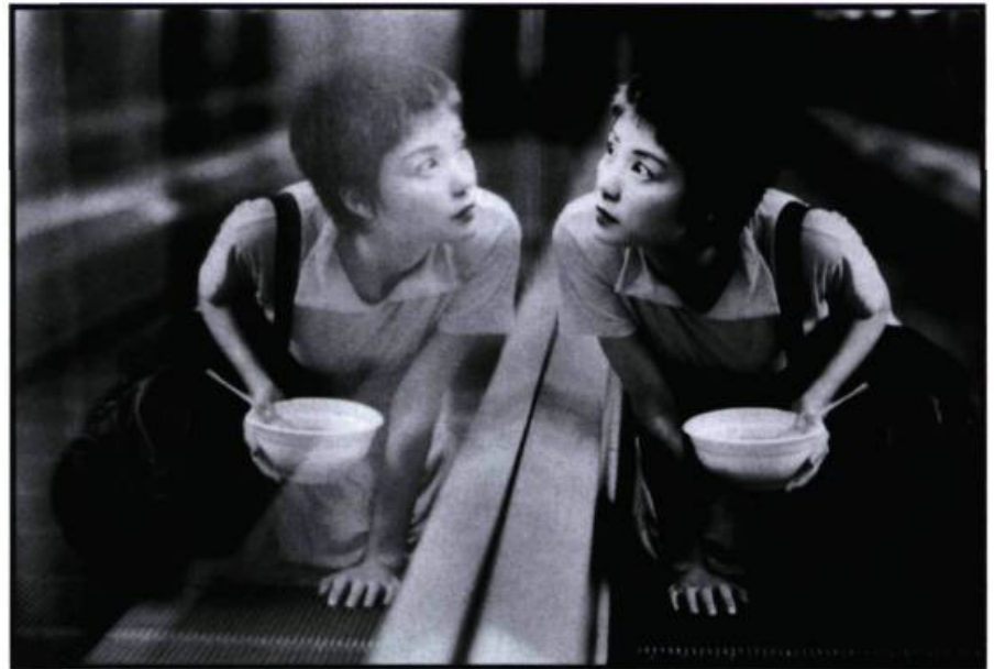
Chungking Express de Wong Kar-Wai (24 images n° 80).

par ordre alphabétique À la vie, à la mort Guédiguian Chungking Express Wong Kar-Wai Délits flagrants Depardon Deux frères, ma sœur Villaverde La cérémonie Chabrol Le couvent Oliveira Le fils du requin Merlet Little Odessa Gray Safe Haynes Sonatine Kitano