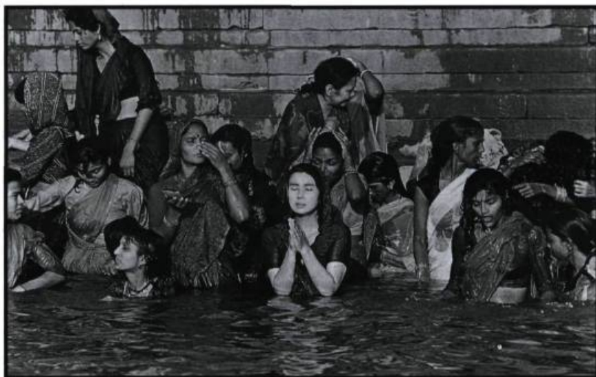
Le fleuve profond. L'immersion dans le Gange.

Au lieu de cinquante Japonais et soixante-dix Indiens, comme dans le tournage à Bénarès, nous sommes quatre Japonais et deux Québécois, passant du japonais au français, parfois ponctués par l'anglais de M me Kumai, revivant à petite échelle le sujet du film. Intéressés par la même question, en situation de recherche quant à l'exactitude des définitions données! Le film se prolonge donc jusqu'ici et chacun, sous les apparences d'un discours sur la