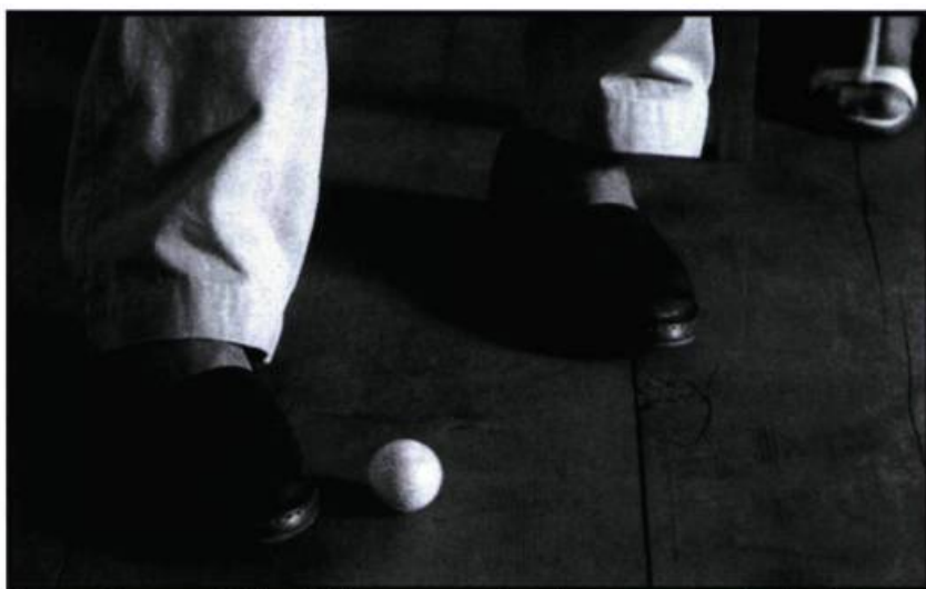
Funny Games . «L'efficacité du recours au hors-champ pour suggérer la violence.»

Michael Haneke se trouve en terrain connu, puisque déjà 71 fragments d'une chronologie du basard (1994) terminait une trilogie sur la violence des médias. Non sans provocation, c'est le regard même du spectateur que Haneke remet encore une fois en question, sommant celui-ci de s'interroger sur son consentement à se laisser manipuler, sur sa complicité, plus ou moins consciente, voire sur son voyeurisme face aux images qui lui sont présentées. À cet égard, une séquence, la plus forte du film en partie à cause de l'endroit où elle trouve à s'insérer dans le cours du récit, se joue du spectateur en convoquant le hors-champ d'une façon terriblement efficace, dans la plus pure tradition du thriller, en privant le spectateur de tout repère sonore, afin de lui faire partager l'angoisse du mari qui, comme le spectateur, imagine le pire alors que sa femme s'est momentanément absentée vers la cuisine afin de se défaire de ses liens. Haneke se conforme ici au genre, plus qu'il ne le détour-