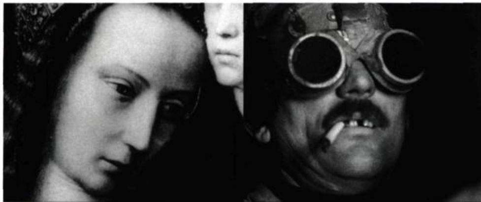
Des images, comme des tableaux rapprochés les uns des autres... Une «association surprenante» commentée par Jean-Daniel Pollet dans L'entrevues .

Enfin, toujours pour montrer comment Pollet porte l'idée de l'essai cinématographique à une sorte de sommet, il faut dire quelques mots de Dieu sait quoi . Il faut dire, en fait, comment ce film saisit l'essentiel de l'esprit de Francis Ponge, comment se trouve appliquée l'idée de dépouillement, comment est affirmée l'autonomie des choses, comment se retrouvent à la fois l'humour, la minutie et la simplicité de l'auteur du Parti pris des choses . Le film prend donc un livre, un écrivain pour point de départ, mais le résultat n'a rien d'une forme dévoyée de l'original. La démarche de Pollet n'est pas de l'ordre de la transcription, pourrait-on dire en utilisant une analogie musicale. Il s'agit d'un film à partir de Ponge et non sur Ponge, c'est-à-dire que Ponge est un point de départ et non quelque chose sur lequel on s'assoit et que par le fait même on écrase. De la même manière — et c'est là sans doute la plus grande qualité du livre — L'entrevues ne se présente pas comme un succédané des films, comme un livre sur Pollet. Les deux auteurs ont abordé le projet avec une véritable attitude créatrice, cherchant à offrir quelque chose de neuf... Et pourquoi éditer s'il ne s'agit pas d'inédit? ■