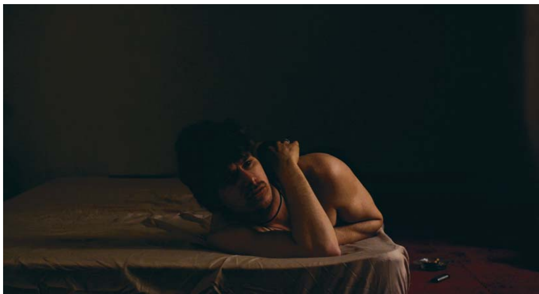
Alex dans L'AMOUR AU TEMPS DE LA GUERRE CIVILE