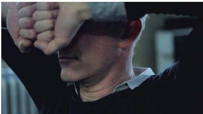
HOMMES À LOUER (1 et 2) et ÉPOPÉE (3)

Les personnages appartiennent à une sorte de tribu avec des liens très forts. La drogue et le sexe les unissent. Ce sont des gens en résistance. On dit que le capital travaille à désubjectiver les personnes pour ensuite les resubjectiver à sa manière. Mais dans cet entre-deux, il y a une possibilité pour les formes de vie de se resubjectiver comme elles l'entendent. C'est dans ces trous-là que la résistance prend un caractère politique. Frantz Fanon parlait du corps de l'homme noir et de l'expérience du colonisé, un corps réduit à l'aspect presque animal. Aujourd'hui, nous sommes tous des colonisés. Mais cette réduction, cette « vie nue » dont parle Agamben offre aussi la possibilité de se resubjectiver de manière inusitée. C'est là qu'est l'utopie, la possibilité d'un monde nouveau.