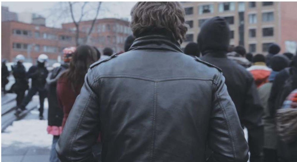
L'AMOUR AU TEMPS DE LA GUERRE CIVILE

« [...] mon travail reste une question de proximité, d'immédiateté et d'immanence. Ce que je fais s'est toujours situé sur ce terrain-là, que ce soit autrefois comme danseur ou aujourd'hui comme réalisateur. La question des formes de vie demeure fondamentale pour moi. Il s'agit toujours de les amener à la présence. »