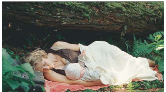
YELLOWKNIFE (1) et LOST SONG (2 et 3)

Même dans des aventures collectives comme Insurgence , qui est aussi une œuvre formelle adoptant une distance, mon travail reste une question de proximité, d'immédiateté et d'immanence. Ce que je fais s'est toujours situé sur ce terrain-là, que ce soit autrefois comme danseur ou aujourd'hui comme réalisateur. La question des formes de vie demeure fondamentale pour moi. Il s'agit toujours de les amener à la présence. Le Comité invisible qui a publié L'insurrection qui vient et À nos amis dit, lui aussi, que le principal problème actuel dans le monde est un problème de présence. Tout est médiatisé par les outils de communication. Donc, se servir d'objets ou de représentations comme la sexualité, montrer des situations où des pulsions se déploient, permet d'agir sur des questions comme celle de la présence. Présence qui fait gravement défaut dans ce monde.