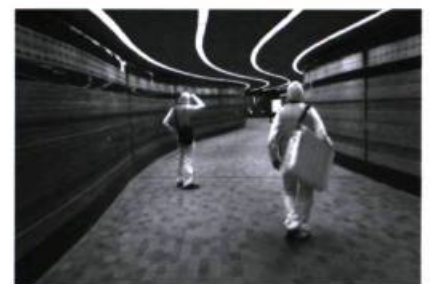
SYN-, Prospectus. Ville intérieure - Randonnée dans un hyperbâtiment , Montréal, 2004.