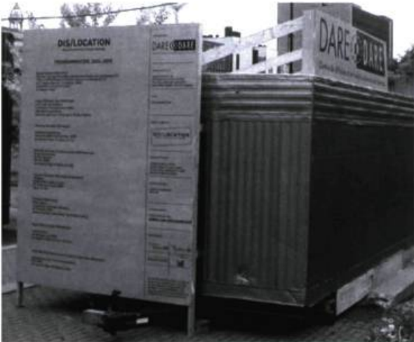
Bureau du centre d'artistes autogéré Dare-Dare. L'abri mobile est sise au square Viger à Montréal (à l'intersection Berri et Viger).

D'éventuelles réponses à ces questions ne peuvent se trouver qu'en formulant ces problématiques à différentes échelles conceptuelle, humaine et territoriale. Pourquoi ? Pour observer à la fois la manifestation d'enjeux de société larges et englobants impliquant l'art actuel dans sa relation à l'espace public et pour observer ce que nous éprouvons collectivement dans les lieux publics et les histoires communes ; pour valoriser les compétences et désirs et les modes d'exploration sensible des lieux des pratiquants de l'ordinaire ; pour observer, sur le terrain, les mutations des manières d'être et de sentir ; pour porter attention aux mobilisations discrètes qui révèlent diverses formes d'appropriation des œuvres ; pour découvrir les micro-utopies, micro-événements et micro-récits qui constituent la trame de la vie quotidienne en ville. Ce n'est qu'en dis/localisant les perspectives pour varier les lieux d'exploration de la question de l'art dans la ville comme « lieu des situations inédites et des rencontres inopinées et non des relations et des positions assignées » 36 qu'il est possible de mieux connaître, comprendre et apprécier le retour du sensible. Pour entrevoir ainsi la coïncidence, l'ouverture et la fermeture de plusieurs mondes.