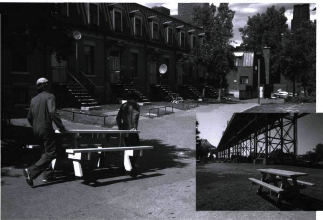
SYN-, Hypothèses d'amarrages , site Petite Bourgogne, Montréal, 2001.

des syntaxes (professionnelles, familiales, sportives ou autres). Les « individus-mots » constituent eux-mêmes les principaux liens entre ces « textes-champs sociaux » en se déplaçant physiquement dans les lieux ou en communiquant virtuellement 27 . Ils possèdent la mobilité et l'agilité qu'a décelées, jadis, De CERTEAU chez les « pratiquants de l'ordinaire ».