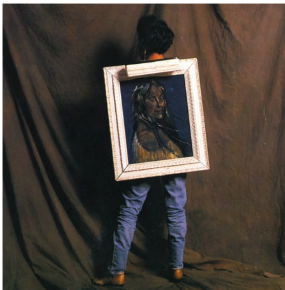
> Rebecca Belmore, Inkwewak Ka-ayamihwat : Means Women Who Are Speaking , 1989.

Nipishtanau Tshishtemau (Je donne le tabac) est exemplaire de ce type d'installation qui propose un parcours 11 et témoigne de cette sacralité du lieu où l'esprit des choses se manifeste plus que les choses elles-mêmes. L'œuvre s'inscrit dans un rapport dialectique entre l'actualisation du mythe purificateur du tabac et le geste créateur de l'artiste, qui renvoie à la mémoire historique et sociale du bâtiment – ancienne usine de l'Imperial Tobacco. Le trajet commence par un pot rempli de tabac haché à l'entrée – symbole de partage et offrande à la Terre – mis à la disposition du visiteur, qui se fait en même temps complice de l'œuvre puisqu'il en conserve un fragment. Celui-ci est invité à suivre le trajet constitué par le déploiement en spirale de feuilles de tabac suspendues au plafond de la grande salle. Au centre se trouve la représentation d'une perdrix (dont la « danse » est associée à la spirale) qui évoque le rituel du calumet sacré. Fait de plumes, d'ossements et d'une mâchoire de bison, ce symbole illustre aussi la femme-bison blanc, personnage mythologique qui a apporté aux êtres humains le calumet sacré et donné au tabac son caractère rituel 12 . Bison et perdrix, gardiens de la survivance et de l'abondance, forment ainsi un couple mettant en scène les symboles mâle et femelle. Des projections de diapositives qui éclairent les longs lambeaux brunâtres et les murs se mélangent aux volutes de fumée de tabac qui se consomment dans l'environnement in situ .