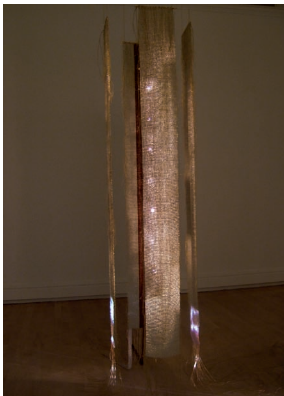
> Sonia Robertson, Refaire l'alliance , Musée national des beaux-arts du Québec, Québec, 2005. Collection du Musée canadien des civilisations.