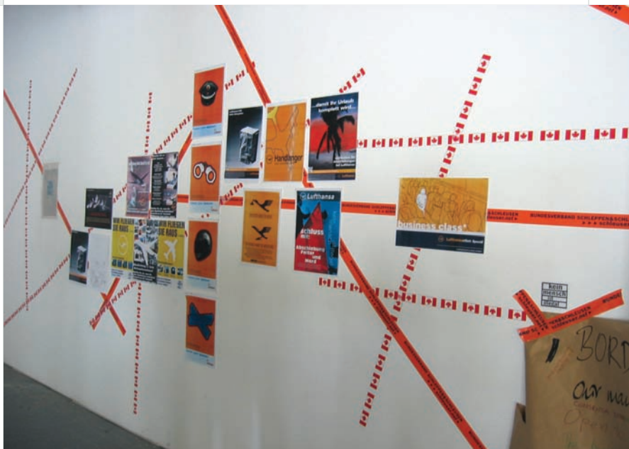
Schleuser.net, Duo. Irrational, CIRCA et Mushon Zer-Aviv, L'Académie de la frontière imaginaire , dans le cadre d' Artivistic [espaces in.occupés] , 2007.

Depuis quelques années, la question de l'éducation et de ses méthodes se pose de plus en plus, tant dans les milieux artistiques que militants, tout autour de la planète. Certaines parlent même d'un knowledge turn ou d'un pedagogical turn 5 . Le capitalisme actuel (qu'il soit « tardif », ou « post- », ou...), nous le voyons s'infiltrer jusque dans les plus infimes parties de la vie. Il est vorace et effréné. Nous le tenons pour fou et craignons un anabolisme fatal. Heureusement, comme il est chaud, il génère de l'ébullition « à la moléculaire » : luttes, résistances, multiplications des foyers de transmutation. À gros bouillon. Il faut naviguer en eaux troubles, car le capitalisme qui a phagocyté l'État même récupère et recycle. Il avale en riant les tentatives d'évasion de cette multitude et les ressort à sa sauce. L'art et l'éducation ne sont évidemment pas à l'abri, particulièrement parce qu'ils sont composés d'éléments d'affect, de langage, de travail immatériel,