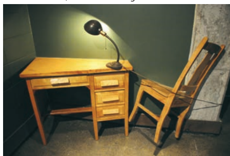
> Alexandre Assaly, Playground .