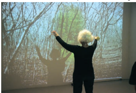
> Esqueleto Coletivo, Eau de conscience