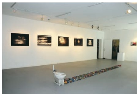
> Rogério Nagaoka