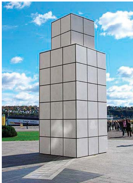
> Jean-Pierre Raynaud, Dialogue avec l'Histoire, 2006.

La démolition de Dialogue avec l'Histoire a fait grand bruit à Québec, au Québec et sur la scène médiatique française. Rappelons un peu les faits. Lundi, mi-juin : l'administration Labeaume annonce qu'elle procédera au « démantèlement » de la sculpture de Jean-Pierre Raynaud dès le lendemain. Aussitôt, la nouvelle fait le tour des médias de tout acabit. Cette annonce