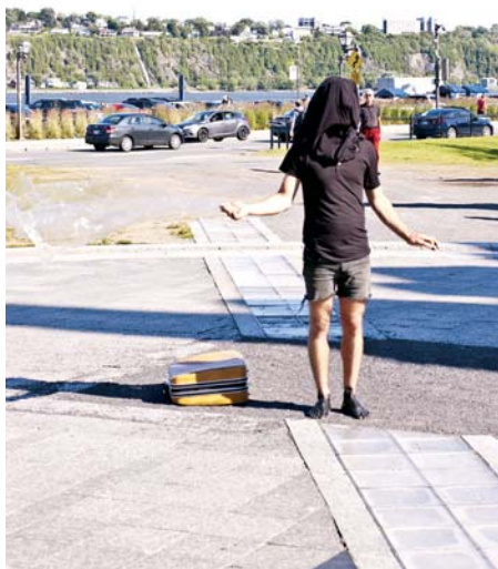
> Steven Girard, Phase II – Art et destruction/Destruction de l'art . 15 juillet 2015.

On a exhibé cette démolition tel un spectacle, comme s'il s'agissait de la victoire du « bon goût », du « vrai monde », comme s'il était question d'un retour à la neutralité de place de Paris. Étrangement, Dialogue avec l'Histoire prend un nouveau souffle depuis sa destruction, comme si la sculpture devenait une métaphore d'elle-même, s'étant inscrite à nouveau dans l'histoire de l'art. Déjà source d'incompréhension et de haine, elle trouve désormais un sens nouveau : par sa disparition, elle prend encore plus d'importance dans la mémoire collective. Cette destruction grotesque ressemble à une (mauvaise) performance artistique. Nous avons maintenant un devoir de mémoire à préserver, les œuvres d'art public appartenant à tous. N'en déplaise au maire Labeaume, la cicatrice creusée à grands coups de pelle mécanique demeure ouverte, et nous sommes plusieurs à ne pas vouloir nous faire soigner. ◀