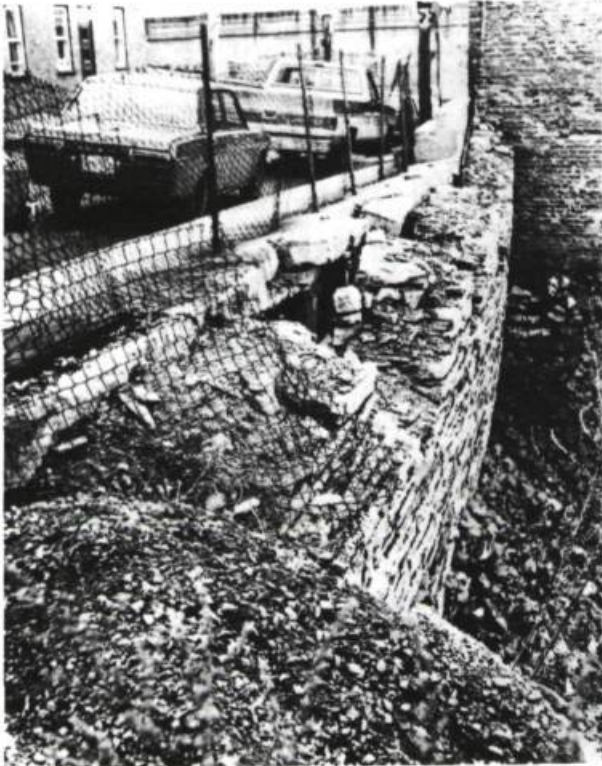
Début de la rue Latourelle Fondations abandonnées après incendie, sans entretien

Au 723-733 St-Olivier, j'ai pu circuler librement à travers ce bâtiment en ruine et prendre des photos sans qu'on note ma présence. Tout y est dans un état lamentable: portes éventrées, remises défoncées, débris de linges et de meubles accumulés dans les pièces.