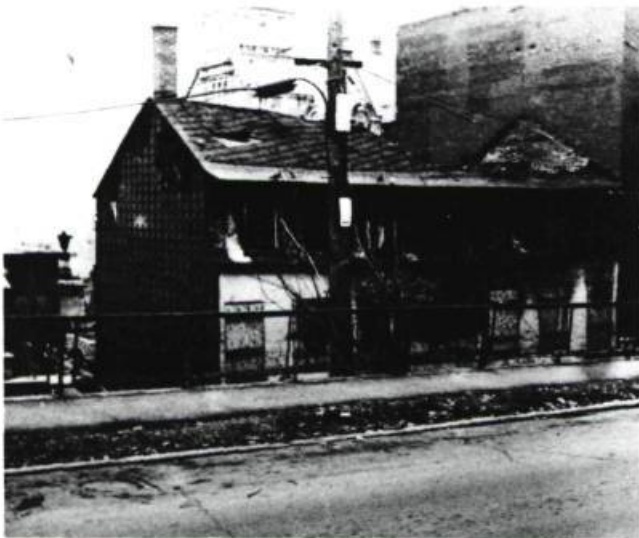
—Entre 388 et 396 Lockwell Incendiée et éventrée. Vestiges abandonnés Depuis plusieurs années et danger permanent pour l'environnement