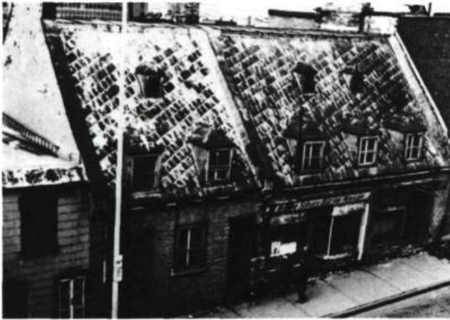
Côte d'Abraham 550 - 564 - 570. Placardée et délabrée