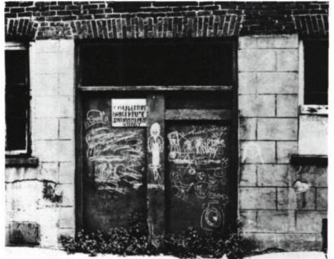
723 à 733 St-Olivier - Arrière du bâtiment et remises enfoncées