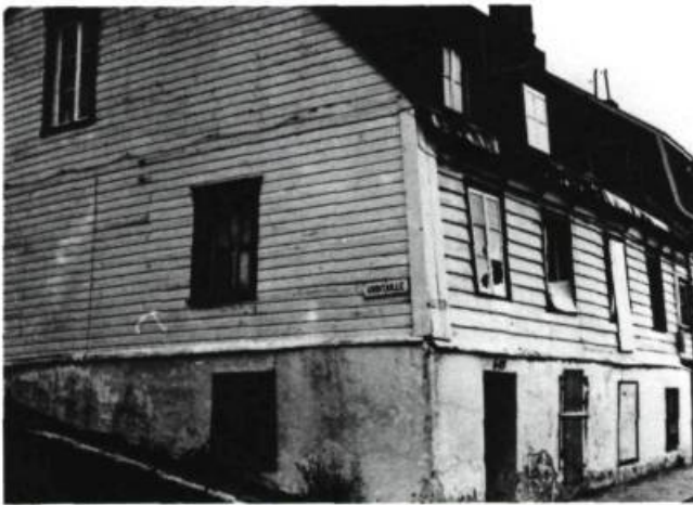
-Maison incendiée, coin Robitaille, St-Réal (645)