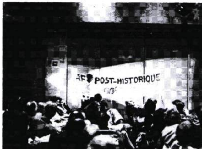
Hervé Fischer, «L'histoire de l'art est terminée», performance au Centre Pompidou, février 1979.

Cette évolution conduit aussi à reconsidérer le statut d'artistes qui, du fait de cette insertion sociale, des budgets ou des techno-