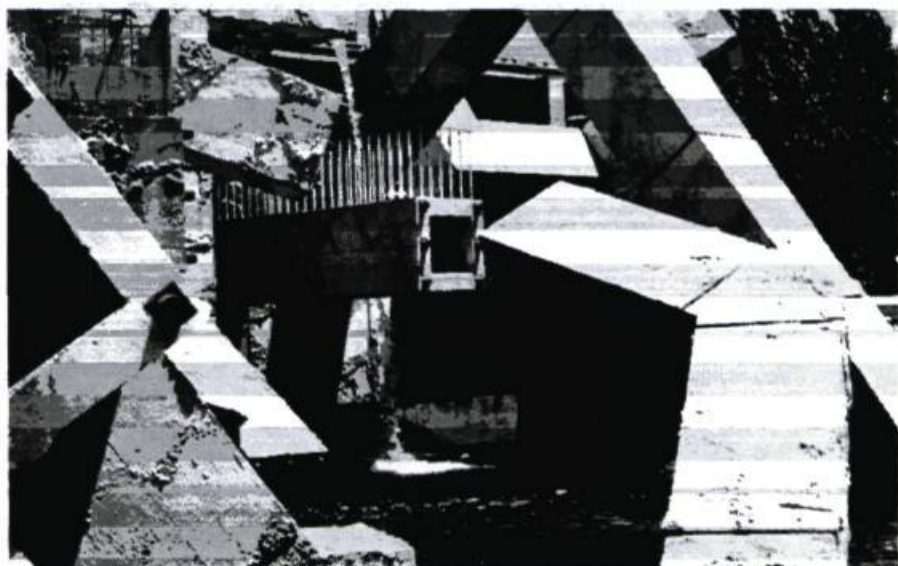
Armand Vaillancourt, Fontaine Embarcadere center, 1969-71, San-Francisco.