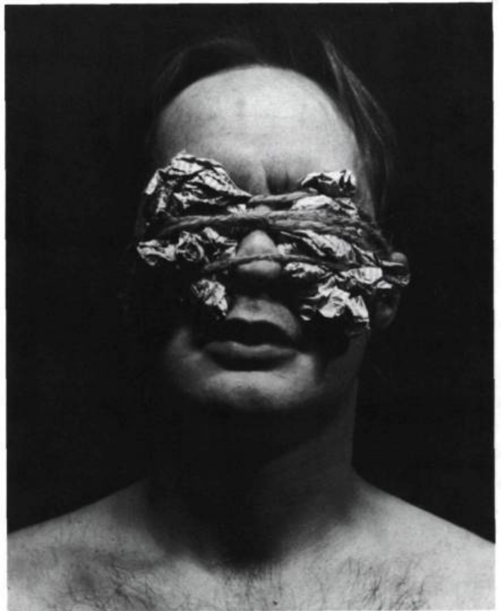
«Transfiguration», 1979; émulsion et acrylique sur toile.