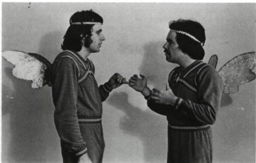
Les Mimes électriques.

technique". Ils peignent vocalement et gestuellement des animaux (corneille, chien), des objets (machine à écrire, avion, fusil) et des personnages (l'Allemand, l'homme des tavernes). La force de leur spectacle ne naît pas seulement de la fidélité de l'imitation sonore, mais de leur incroyable sens du rythme : "C'est ben vite, puis c'est ben timé ." C'est ainsi que le passage d'un avion, par exemple, est rendu par une dynamique du bruit qui va du pianissimo au fortissimo, l'activité d'une dactylo, par le rythme varié de sa machine avec ses crescendos et diminuendos. Le tout agrémenté, en contrepoint, de "surprises", d'interruptions inattendues, de gestes, d'interventions humoristiques qui emportent l'adhésion du public. Ce dernier est, par ailleurs, entraîné par un rythme accéléré dans une suite quelquefois compliquée d'histoires dans lesquelles les personnages s'enchevêtrent et se rejoignent. Parfois perdu, abasourdi, il doit constamment "travailler" avec les mimes à reconnaître la trame, à être complice; c'est aussi un atout majeur des Mimes électriques : le sens du public.