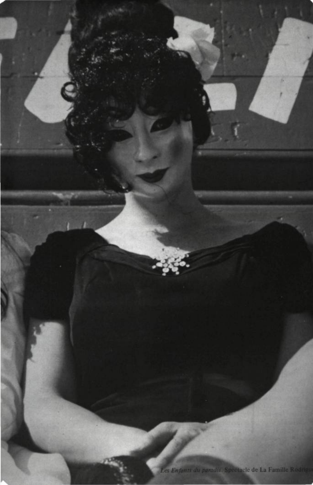
Les Enfants du paradis. Spectacle de La Famille Rodriguez