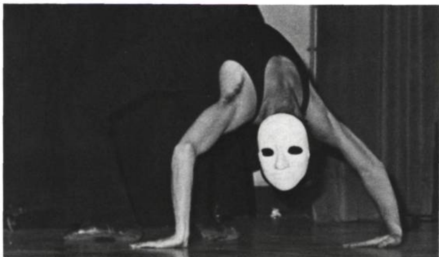
Fantascope . Spectacle de La Grosse Valise.