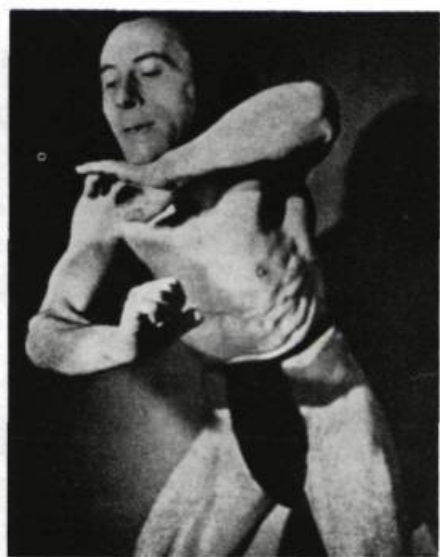
Le Menuisier. Etienne Decroux.