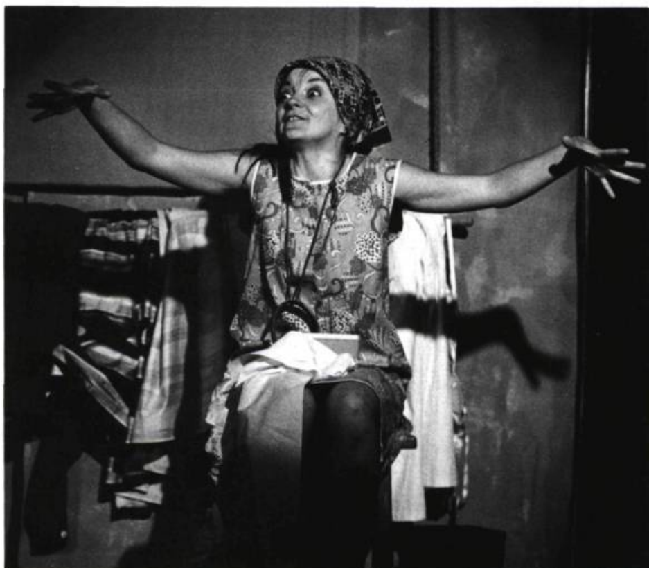
Lo Teatre de la Carriera. Saisons de femmes . École Nationale de Théâtre. Avril 1980.

propos recueillis par lorraine hébert et francine Noël, mai 80