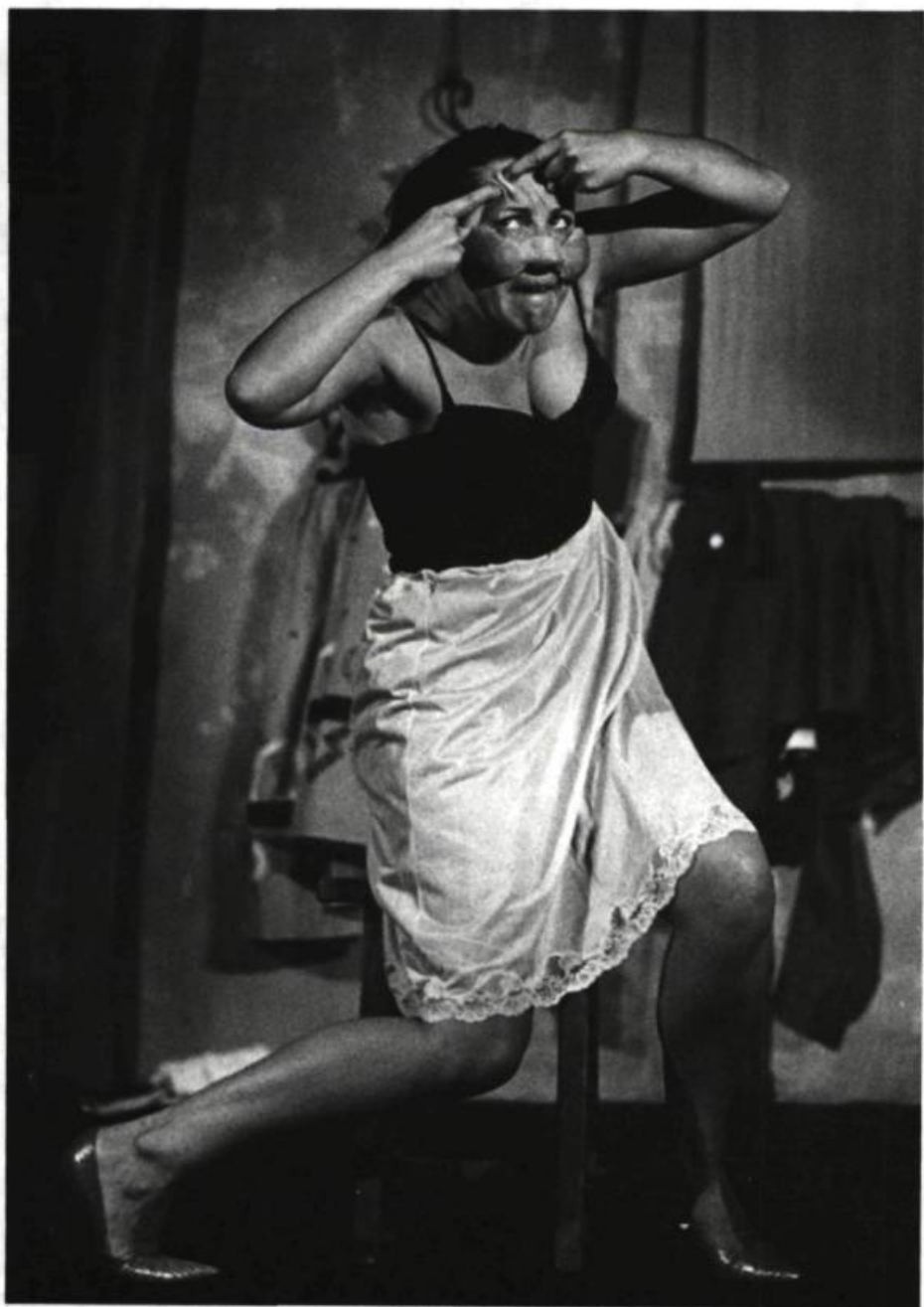
Lo Teatre de la Carriera. Saisons de femmes . École Nationale de Théâtre, avril 1980.