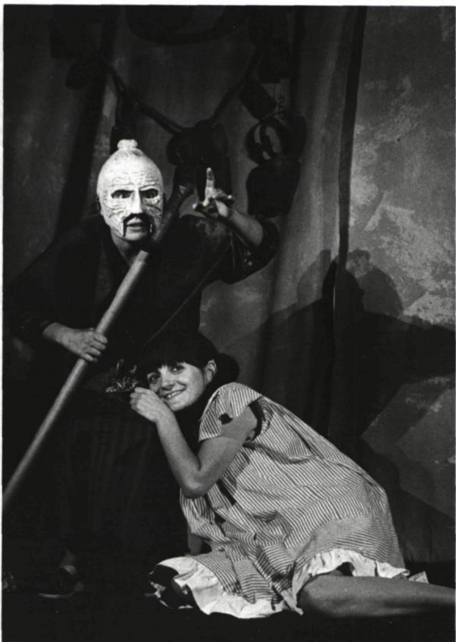
Lo Teatre de la Carriera. Saisons de femmes . École Nationale de Théâtre, avril 1980. (Photo: Charles Camberoque).