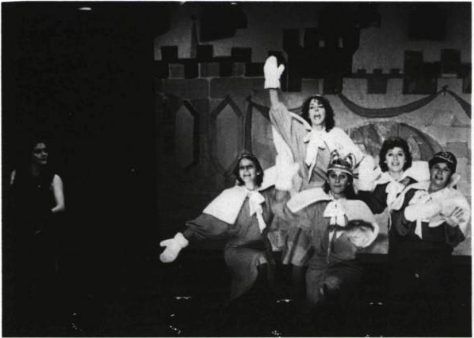
Enfin duchesses des Folles Alliées au Théâtre Expérimental des Femmes: la séduction conjuguée de la comédie et du lieu inhabituel.

duchesses 1 , au Théâtre Expérimental des Femmes, ils se sont littéralement esclaffés devant les estrades et les petits coussins remplis de sable, créant, de ce fait, une atmosphère plutôt survoltée. Aucun problème lorsque la pièce est une comédie; les ondes déagées de part et d'autre se rejoignent et la magie opère. Cela fut moins heureux, cependant, pour Addolorata 2 , au café-théâtre La Licorne, pièce plus sérieuse et cérébrale à laquelle le public étudiant a fort peu « accroché », tout occupé qu'il était à boire de la bière et à trouver les salles de toilettes! Néanmoins, les réactions outrées (« C't'un trou icitte! »), sarcastiques (« Aie, c'est chic! ») ou enthousiastes (« C'est flyé, mais j'aime ça! ») me semblent préférables à l'espèce d'apathie vaguement ennuyée qui envahit les jeunes lorsqu'ils prennent place dans un « vrai » théâtre.