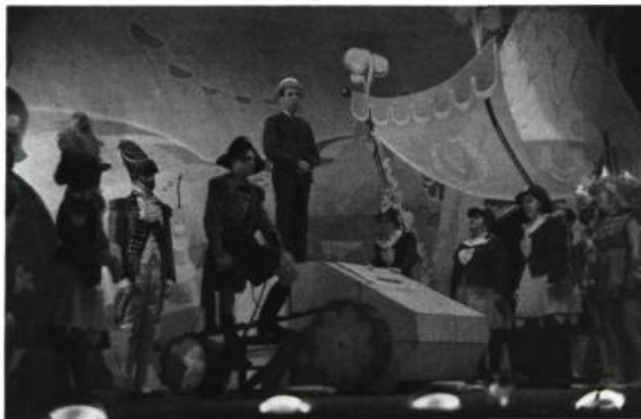
Revue. Les Fridolinades : inspirées de la réalité politique. Archives publiques du Canada, coll. Bibliothèque municipale de Montréal, PA-160758. Photo : Henri Paul.