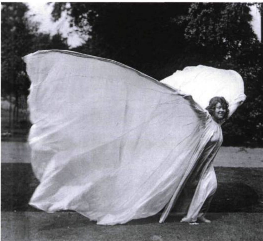
Loie Fuller, vers 1900.

« Avec Trisha Brown, le mouvement de démocratisation de la danse s'accélère. » Le costume rejoint alors ce que le théâtre d'Europe de l'Est, avec l'esthétique du « Théâtre pauvre » de Grotowski, met en avant : le dépouillement au profit du sens. Le théâtre est une boîte noire, le geste brut, le décor déconstruit. La scénographie adopte une position de recherche face à l'art, tantôt politique, tantôt sociale, tantôt plus philosophique et même métaphysique. « On se met à pratiquer la danse dans des lieux incongrus, comme les rues, les studios désaffectés, les espaces publics. On s'habille alors de façon ordinaire, avec des vêtements tout aller propres à ne pas entraver le mouvement. » Pensons au rap, à son allure pauvre et décontractée. Ce style correspond à un état social de la danse, à ses moyens limités. Chez Danièle Desnoyers, chez Catherine Tardif, dans maintes aventures menées par Danse-Cité, le costume adopte fréquemment cette tournure. On y exprime, ce faisant, des refus et des protestations.