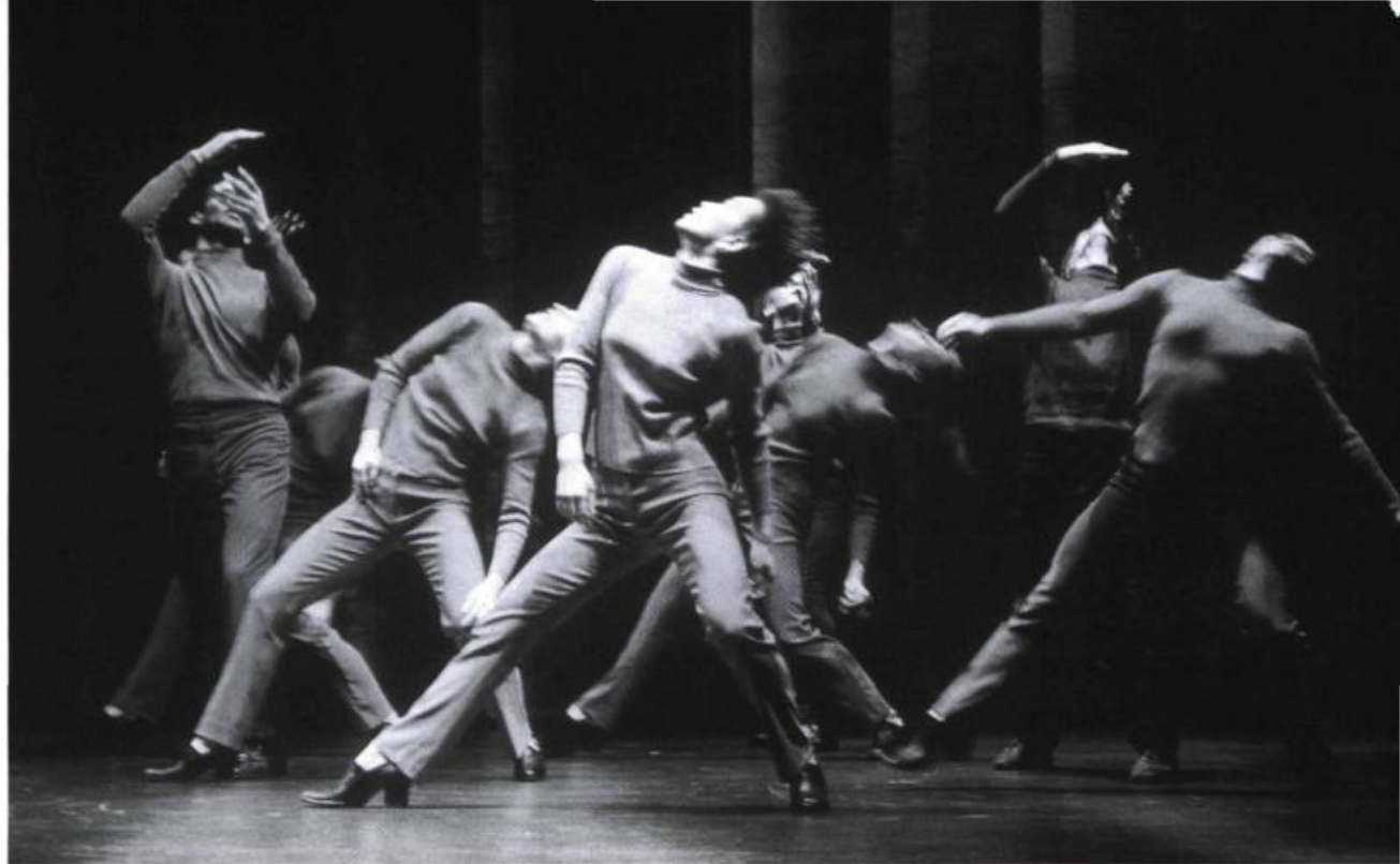
La Vie qui bat de Ginette Laurin (O Vertigo, 1999).

tient au noir, avec ces grosses chaussures lourdes et bruyantes, si peu élégantes, qui accusent leur allure d'accessoire de danse sociale ; l'effet, continu dans ses pièces, donne à ses chorégraphies une marque inoubliable. Dans sa dernière création, l'Exil – l'Oubli , les interprètes se dévêtent et se déchaussent peu à peu, révélant leur peau nue et un monde sensible du corps sans jamais accéder à un corps intime, ni sexué, ni privé, en dépit des innombrables touchers. Le costume fait écran. Dans Documents II de Lynda Gaudreau (2000), les interprètes portent notamment un costume de ville avec des chaussures de bowling. De ce costume sportif, on passe à la nudité. Chez Laurin, Perreault ou Gaudreau, les signes du costume renvoient aux réalités locales. Mais leurs esthétiques se décodent aisément par-delà les frontières.