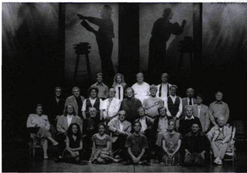
Hommage à Gaston Miron le 3 juin 1997, à la salle Pierre-Péladeau.