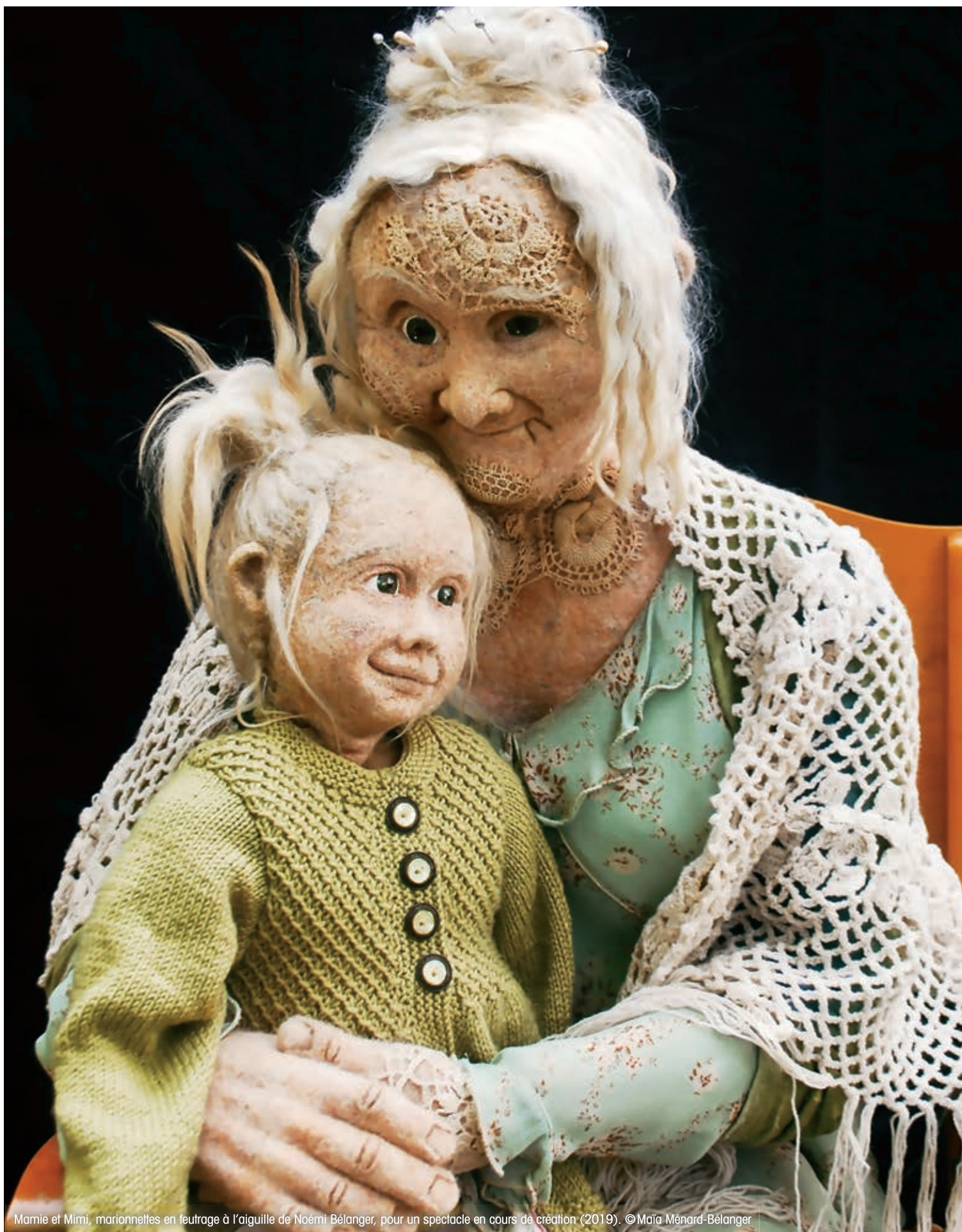
Mamie et Mimi, marionnettes en feutrage à l'aiguille de Noémi Bélanger, pour un spectacle en cours de création (2019).