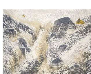
Les régions du Québec ont un rendez-vous avec elles-mêmes