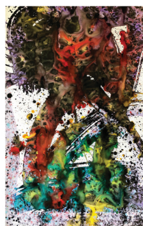
Brexit et Catalogne Les voies inconnues