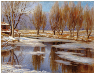
Maurice Séguin : le sens de l'héritage