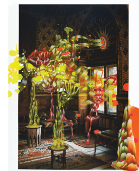
Français Reprendre l'initiative

Dix numéros par année des analyses sérieuses, des dossiers inédits, un regard assumé sur les essais, un point de vue québécois sur le monde