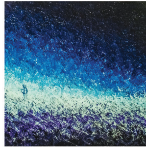
Gazoduc Saguenay, le gaz et le non-sens