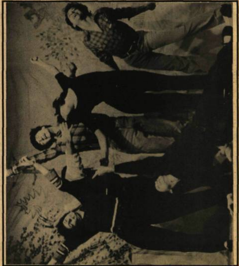
Le théâtre d'la vieille 17: Les murs de nos villages