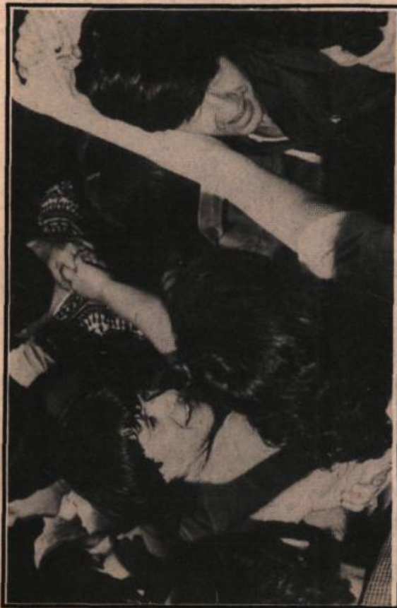
Atelier BOAL