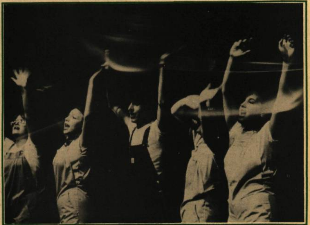
Les Franco-Fous: Sourire en larmes