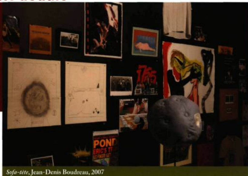
Sofa-tête, Jean-Denis Boudreau, 2007