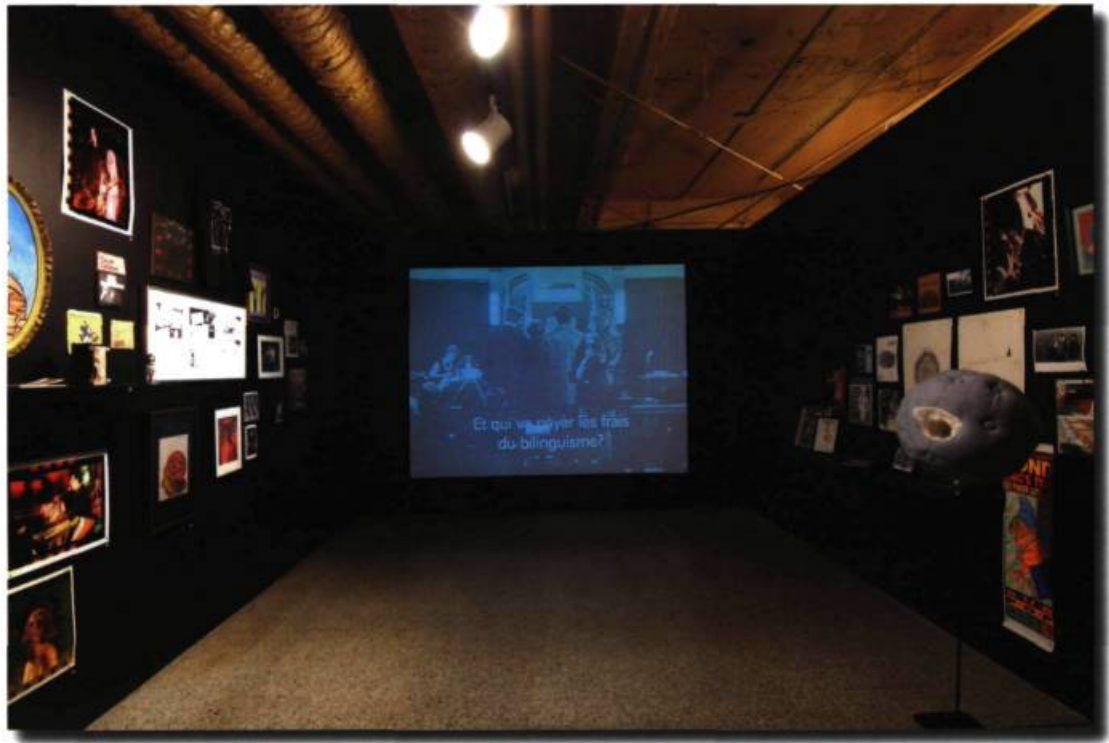
L'Acadie, l'Acadie ??? , Michel Brault et Pierre Perrault, 1971

vaste, nous propose une variété d'œuvres, dont plusieurs d'un format important : peintures, collages, photographies retouchées et sérigraphies. À gauche encore, s'ouvre une petite salle où l'on peut voir un tableau hyperréaliste et un montage de dessins à la ligne agrémentés de photos en noir et blanc, placées sur plusieurs petites feuilles tirées d'un carnet de voyage. Une table et une chaise complètent le décor de la pièce.