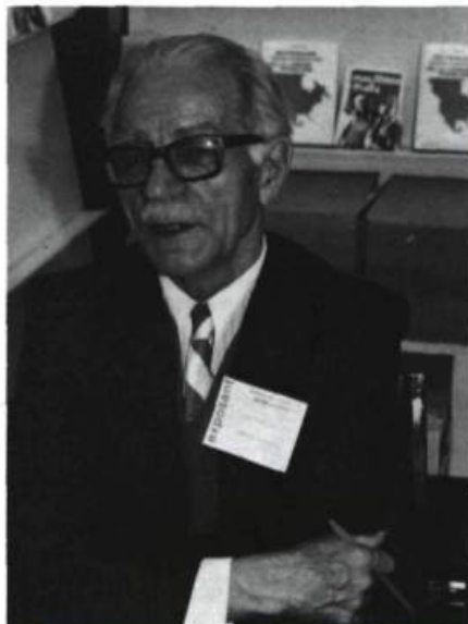
L.A. Bélisle

De plus, la définition de cette deuxième catégorie de canadianismes, soit les « canadianismes familiers ou folkloriques », est pour le moins discutée. Il semble qu'on ait fait entrer dans cette catégorie tout mot ou accep-